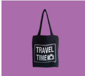
Gambar 2.4 Goodie Bag