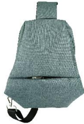
Gambar 2.9 Waist Bag