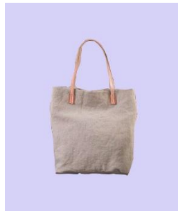
Gambar 2.6 Tote Bag