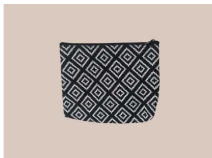
Gambar 2.5 Pouch Bag