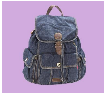
Gambar 2.3 Backpack