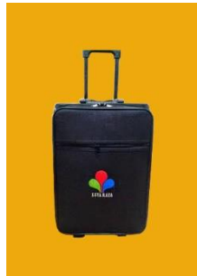
Gambar 2.8 Trolley Bag