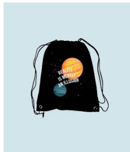
Gambar 2.7 String Bag