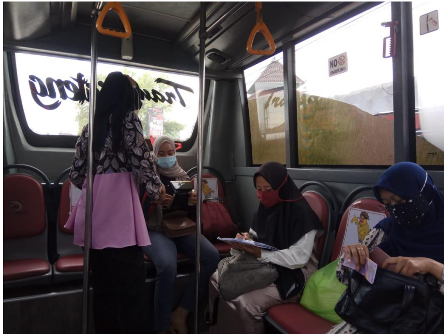
Gambar 2. 12 Pembayaran Tiket BRT Trans Jateng Purwokerto-Purbalingga