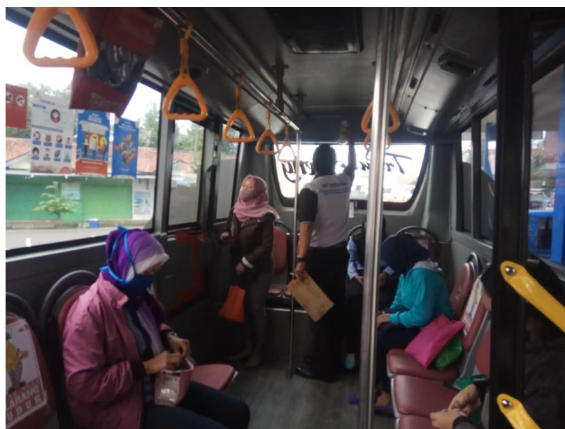
Gambar 2. 11 Armada BRT Trans Jateng Purwokerto-Purbalingga