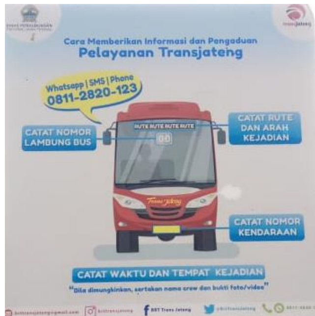
Gambar 2. 5 Info Pengaduan BRT Trans Jateng Purwokerto-Purbalingga