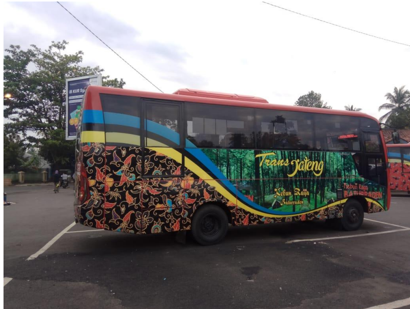
Gambar 2. 10 Armada BRT Trans Jateng Purwokerto-Purbalingga