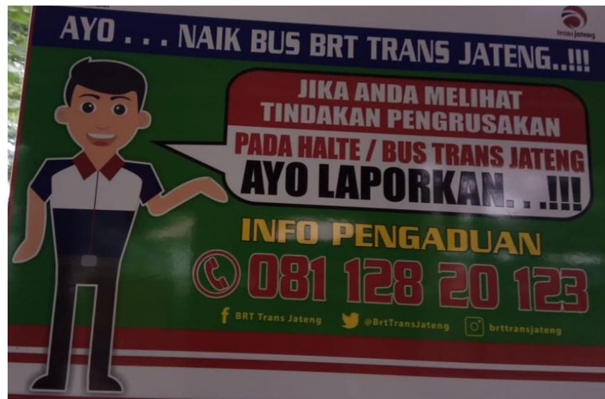
Gambar 2. 4 Info Pengaduan BRT Trans Jateng Purwokerto-Purbalingga