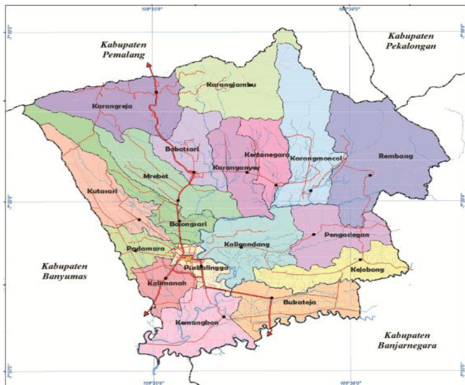
Gambar 2. 2 Peta Wilayah Kabupaten Purbalingga

Wilayah Kabupaten Purbalingga memiliki luas wilayah yaitu 77.764 Ha yang terdiri dari 18 kecamatan. Kabupaten Purbalingga memiliki beberapa ciri khas yang membedakan dengan wilayah lainnya yaitu adanya industry rambut palsu (wig), bulu mata palsu ( eye lash ), industry Knalpot Braling, pariwisata Goa Lawa, Owabong (Kolam Renang), dan Makanan Mendoan. Adapun peta Kabupaten Purbalingga, yaitu :