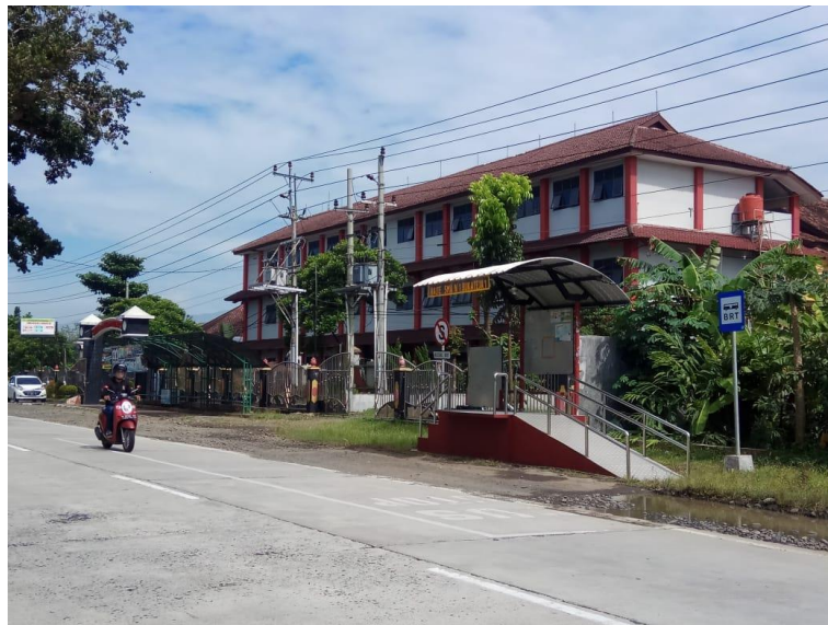
Gambar 2. 7 Halte BRT Trans Jateng Purwokerto-Purbalingga