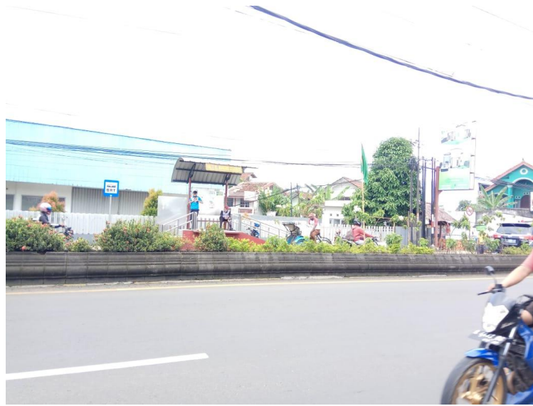
Gambar 2. 8 Halte BRT Trans Jateng Purwokerto-Purbalingga