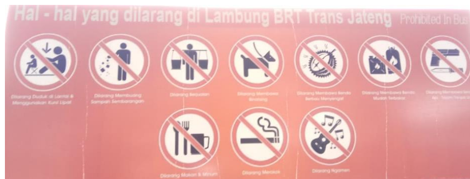
Gambar 2. 13 Aturan diBRT Trans Jateng Purwokerto-Purbalingga