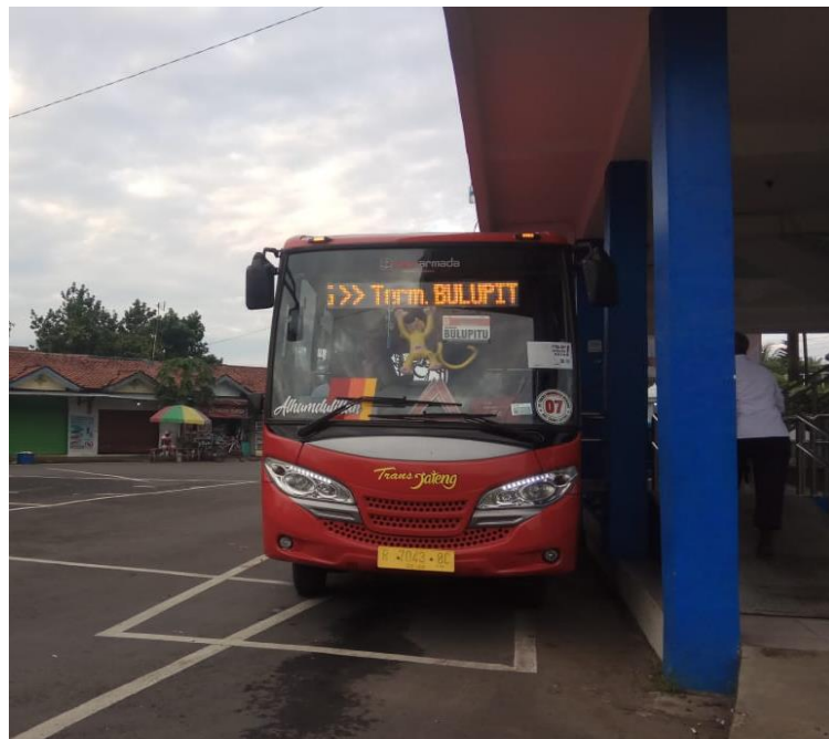
Gambar 2. 9 Armada BRT Trans Jateng Purwokerto-Purbalingga