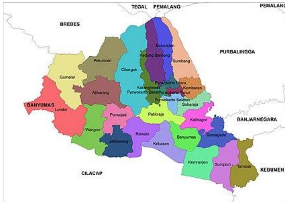
Gambar 2. 1 Peta Wilayah Kabupaten Banyumas

Purwokerto yaitu Obyek Wisata Baturaden. Berikut peta wilayah Kabupaten Banyumas :