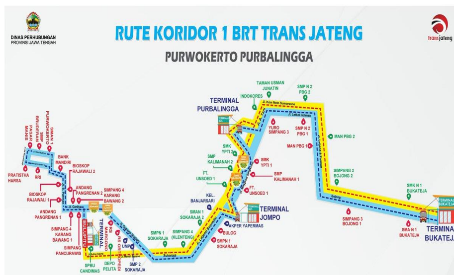
Gambar 2. 3 Denah Rute Koridor I BRT Trans Jateng Purwokerto-Purbalingga

Begitu juga di wilayah Purwokerto-Purbalingga, yang sudah mengoperasikan BRT sejak sekitar bulan Agustus 2018. BRT tersebut diberi nama BRT Trans Jateng Koridor I Purwokerto-Purbalingga. Adapun rute atau jalur BRT Trans Jateng Purwokerto-Purbalingga sepanjang 26,7 km. Mulai dari Terminal Bulu Piitu Puwokerto - Jl. Sultan Agung – Jl. Menteri Supano – Jl. Jendral Soediman Sokaraja – Jl. Letjend Suprpto – Jl. Klahang Sokaraja – Jl. Jompo Kulon – Jl. Meyjendd Sungkono – Jl. Achmad Yani – Jl. Komisaris Noto Sumarsono – Jl. Lettkol Isdiman - Jl. Letjen S. Parman - Jl. Raya Bojong – Jl. Raya Purbalingga Banjarnegara – kemudian berakhir di Terminal Bukateja. Berikut denah rute Koridor I BRT Trans Jateng Purwokerto-Purbalingga :