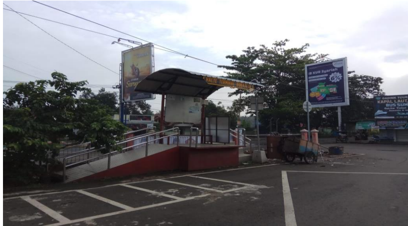
Gambar 2. 6 Halte Terminal Bukateja BRT Trans Jateng Purwokerto-Purbalingga