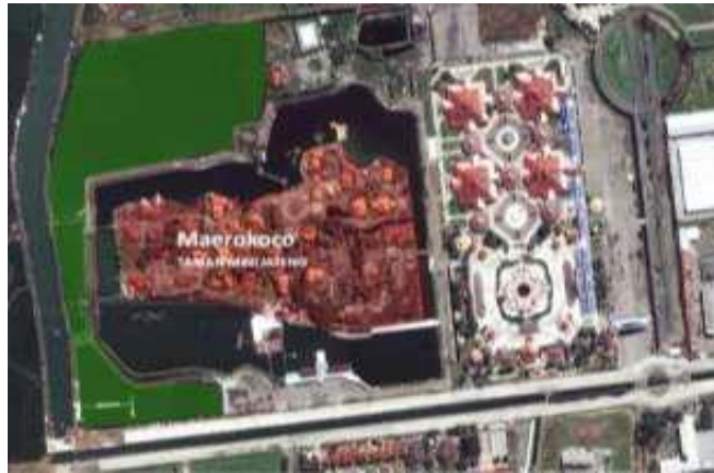
Gambar 2.2 Grand Maerakaca dilihat dari atas