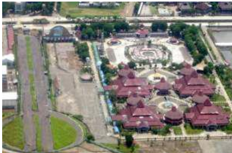
Gambar 2.1 Lokasi PT. PRPP Jawa Tengah dilihat dari atas

Digunakan untuk kegiatan olahraga otomotif sedangkan untuk stand event ini menyediakan sedikitnya 500 stand setiap tahunnya. Stand pameran yang ditawarkan terdiri atas stand lingkungan indoor (dalam ruangan) dan outdoor (luar ruangan).