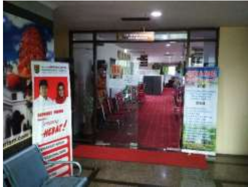
Gambar 2.2 Dinas Kebudayaan Dan Pariwisata Kota Semarang