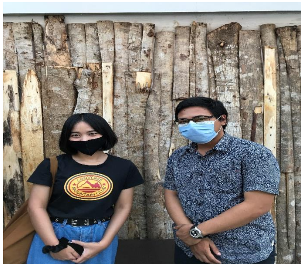
Dokumentasi Wawancara dengan Pengunjung Destinasi Wisata Kota Lama Semarang