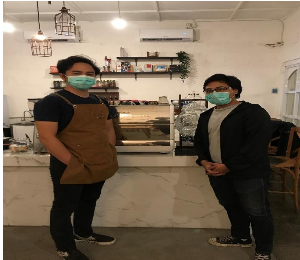
Dokumentasi Wawancara dengan Pelaku Usaha di Kawasan Kota Lama Semarang