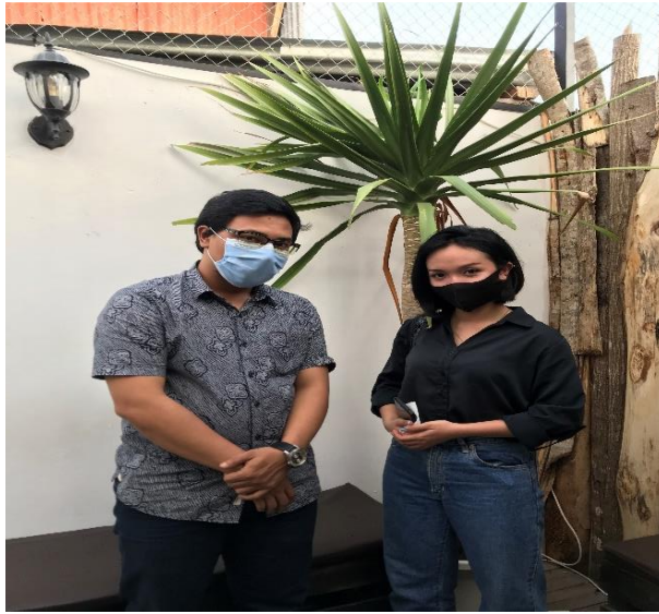
Dokumentasi Wawancara dengan Pengunjung Destinasi Wisata Kota Lama Semarang