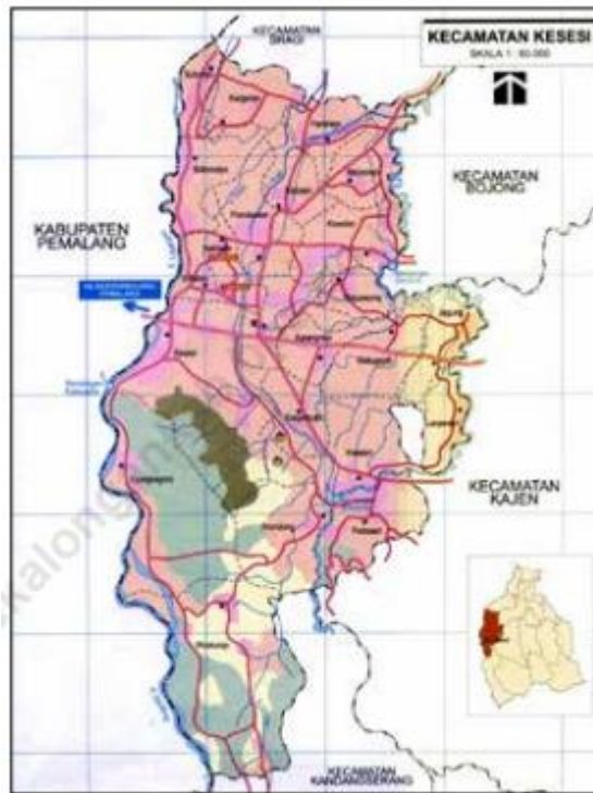
Gambar 2.2 Peta Wilayah Kecamatan Kesesi