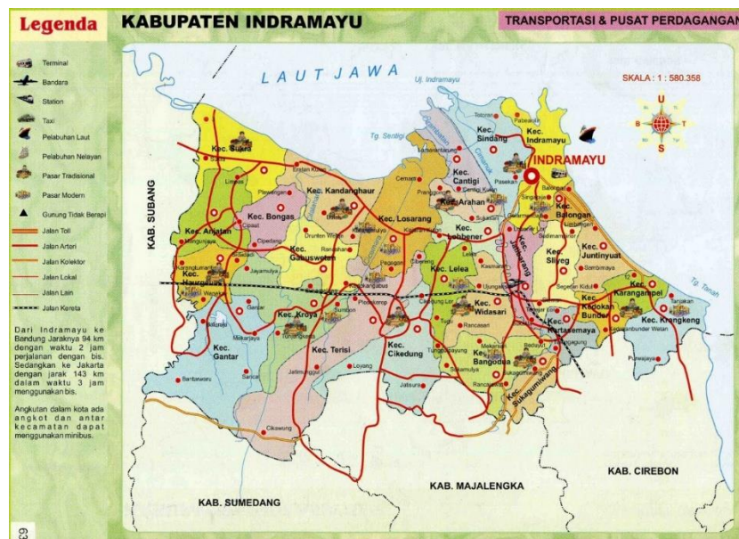
Gambar 2. 2 Peta Kabupaten Indramayu

Kabupaten Indramayu berbatasan langsung dengan Laut Jawa di sebelah utara, Kabupaten Subang di sebelah barat, Kabupaten Cirebon di sebelah timur, serta Kabupaten Sumedang dan Kabupaten Majalengka di sebelah selatan. Letak geografis tersebut menjadikan Indramayu sebagai daerah pesisir dengan potensi sumber daya kelautan dan perikanan yang cukup besar.