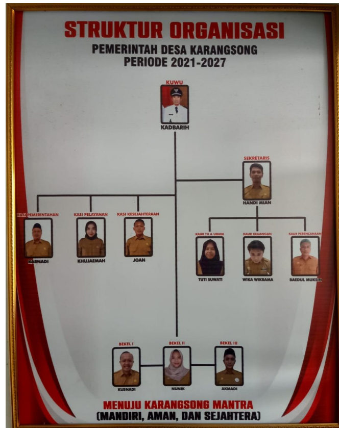
Gambar 2. 3 Struktur Organisasi Pemerintah Desa Karangsong

antarperangkat desa. Susunan lembaga Pemerintah Desa Karangsong, Kecamatan Indramayu, Kabupaten Indramayu, adalah sebagai berikut: