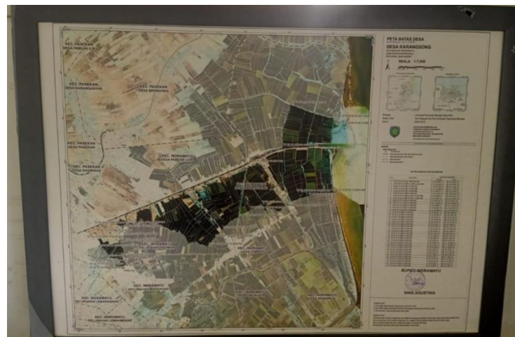
Gambar 2. 4 Peta Desa Karangsong

Pelayanan Khujaremah dan bidang kesejahteraan masyarakat dikelola oleh Kasi Kesejahteraan Joan. Pada bidang administrasi dan pengelolaan desa, Kaur TU dan Umum dijabat oleh Tuti Suwati, Kaur Keuangan oleh Wika Wikrama yang bertanggung jawab terhadap pengelolaan keuangan desa, serta Kaur Perencanaan oleh Baedul Muskin yang bertugas menyusun program dan perencanaan pembangunan desa. Selain itu, Pemerintah Desa Karangsong juga didukung oleh unsur kewilayahan yang terdiri dari Bekel 1 Kusnadi, Bekel 2 Nunik, dan Bekel 3 Akmadi yang membantu pelaksanaan pemerintahan serta koordinasi dengan masyarakat di wilayah masing-masing di Desa Karangsong, Kecamatan Indramayu.