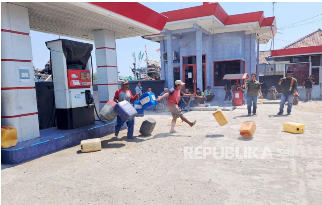
Gambar 1. 1 Nelayan Indramayu Mengamuk di SPBN Karangsong

Menurut Kusnadi (2002:202), tekanan sosial ekonomi yang dihadapi oleh nelayan dipengaruhi oleh berbagai faktor yang saling berkaitan dan cukup kompleks. Faktor-faktor tersebut dapat dibedakan menjadi dua kategori, yaitu faktor alamiah dan non-alamiah. Faktor alamiah meliputi perubahan musim penangkapan ikan serta keterbatasan kemampuan sumber daya manusia. Sementara itu, faktor non-alamiah mencakup terbatasnya akses terhadap teknologi penangkapan, kekurangan modal, ketimpangan dalam sistem pembagian hasil, serta ketiadaan jaminan sosial yang jelas bagi tenaga kerja nelayan, terutama tentang keahlian nelayan.