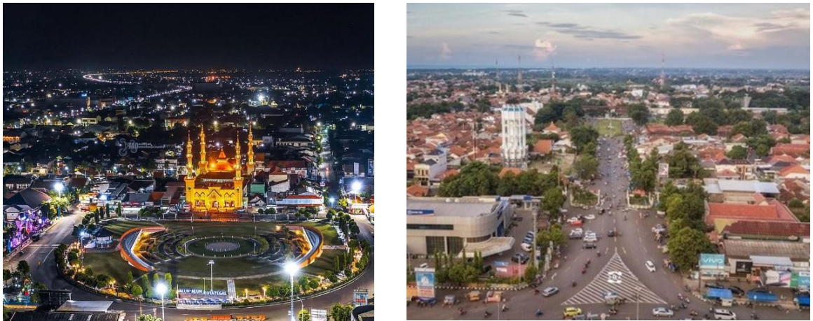
Gambar. Kota Tegal

Kota Tegal merupakan bagian dari wilayah Provinsi Jawa Tengah yang berada di ujung barat, dengan luas daerah di tahun 2020 mencapai 39,24 km atau sekitar 0,12 persen dari Jawa Tengah. Kota Tegal secara geografis terletak pada 109°08' - 109°10' Bujur Timur dan 6°50' - 6°53' Lintang selatan. Posisinya berada di pertigaan jalur Purwokerto-Jakarta dan Semarang-Jakarta. Kota Tegal memiliki ketinggian \pm 3 meter dari permukaan air laut di wilayah utara dan barat, dengan kemiringan sungai rata-rata dibawah 0-2%. Bentuk topografi diwarnai oleh tiga sungai besar yaitu Ketiwon, Kemiri dan Gangsa, sehingga dijumpai adanya Food Plain (endapan sekitar muara sungai). Di wilayah kaligangsa elevansi tanah terutama sebelah utara digunakan sebagai tambak karena airnya asin dan pada