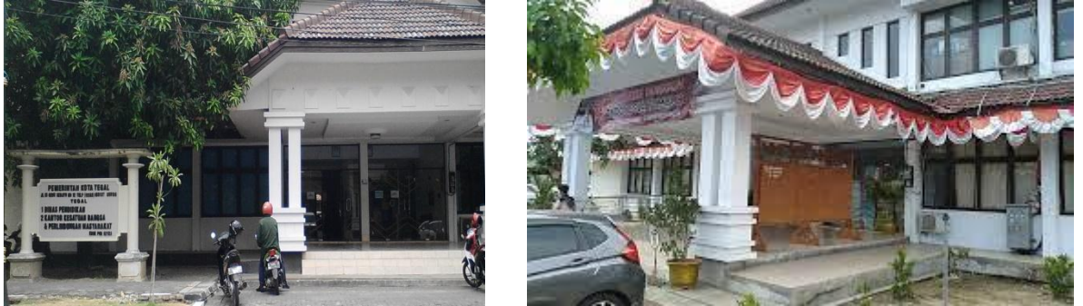
Gambar. Kantor Disdikbud Kota Tegal Tampak Luar

Dinas Pendidikan dan Kebudayaan Kota Tegal merupakan unsur dari pelaksanaan pemerintah daerah yang mana dipimpin oleh seorang kepala dinas, yang berada di bawah dan bertanggung jawab kepada walikota melalui Sekretaris daerah, yang bertujuan untuk memberikan pelayanan secara prima dan meningkatkan pemerataan pendidikan yang berkualitas kepada masyarakat. Kantor Dinas Pendidikan dan Kebudayaan Kota Tegal berada di Balai Kota Tegal yang terletak di Jalan Ki Gede Sebayu Nomor 1 Kota Tegal yang berdampingan dengan Alun-Alun Kota Tegal. Tugas dan fungsi Dinas Pendidikan dan Kebudayaan Kota Tegal diatur dalam Peraturan Walikota (Perwal) Nomor 47 Tahun 2021 Tentang Kedudukan, Susunan Organisasi, Tugas dan Fungsi serta Tatat Kerja Dinas Pendidikan dan Kebudayaan Kota Tegal. Dinas Pendidikan dan Kebudayaan Kota Tegal mempunyai tugas dalam membantu walikota dalam melaksanakan urusan pemerintahan yang menjadi kewenangan Daerah dan tugas pembantuan di bidang pendidikan dan bidang kebudayaan.