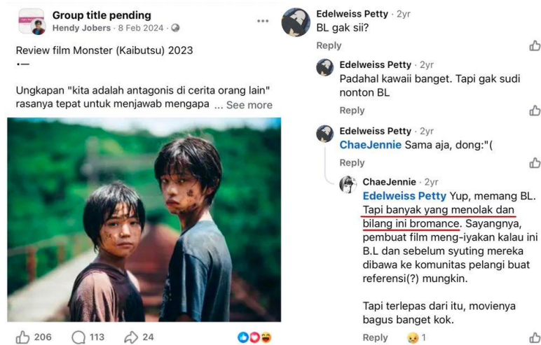
Gambar 1.1 Komentar warganet terkait hubungan Minato dan Yori dalam film Monster (2023)