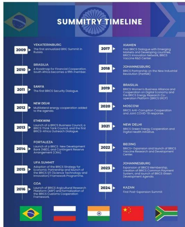
Gambar 2.2 Summitry Timeline BRICS