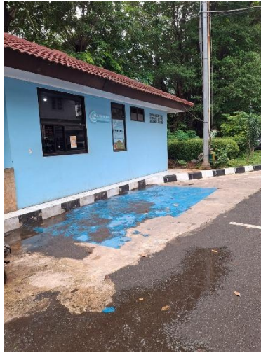
Gambar 2.3 Pelayanan LOPER KTP-EL di Disdukcapil Kota Bekasi

Senin-Jumat, sehingga menjadi lokus untuk sampel pengguna e-open 2.0 yang diambil pada penelitian ini.