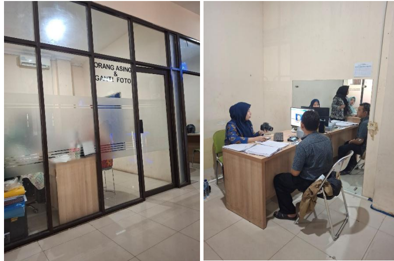
Gambar 2.2 Pelayanan Ganti Foto KTP di Disdukcapil Kota Bekasi

sehingga menjadi lokus untuk sampel pengguna e-open 2.0 yang diambil pada penelitian ini.