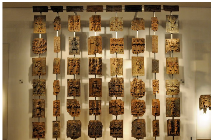
Gambar 2.5. Display Benin Bronze di British Museum

Benin Bronze merujuk pada koleksi besar artefak kerajaan yang berasal dari Kerajaan Benin (Sekarang Nigeria Selatan). Meskipun disebut "bronze," koleksi ini sesungguhnya terdiri atas berbagai medium: plakat-plakat relief dari kuningan ( brass ), kepala-kepala komemoratif dari perunggu, gading ukiran, manik-manik koral, besi, kayu, dan benda-benda seremonial lainnya. Plakat kuningan kotak dahulu menghiasi tiang-tiang istana kerajaan, menggambarkan sejarah seremonial dan politik Kerajaan Benin (Hicks, 2021). Koleksi karya seni merupakan salah satu arsip hidup dari sebuah peradaban yang besar.