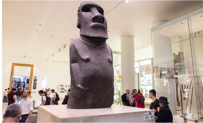
Gambar 2.1. Patung Batu Raksasa Hoa Hakananai'a di Galeri Living and Dying, British Museum