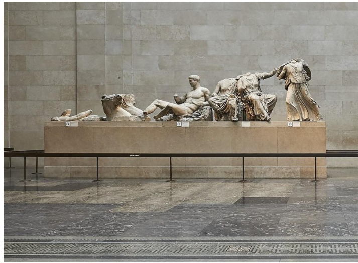
Gambar 2.4. Parthenon Marbles di Galeri British Museum

Yunani telah menentang keberadaan Parthenon Marbles di British Museum sejak mendapatkan kemerdekaannya. Hanya empat tahun setelah kemerdekaan, pada tahun 1834, undang-undang nasional pertama tentang benda purbakala diberlakukan, yang secara formal melindungi warisan budaya dan mengkarakterisasi benda purbakala sebagai milik nasional (Voudouri, 2010). Upaya diplomatik besar dipimpin pada tahun 1983 oleh Melina Mercouri, Menteri Kebudayaan Yunani saat itu, yang menekankan patung-patung tersebut sebagai elemen sentral dari identitas ( The Parthenon Marbles – Melina Mercouri Foundation , t.t.). Yunani Argumen dari Yunani menyatakan bahwa izin Elgin untuk melepaskan pahatan yang ada di Parthenon tidak valid.