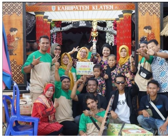
Gambar 2. 6 Partisipasi Desa Wisata Jarum dalam Gelar Desa Wisata Tingkat Provinsi Jawa Tengah Tahun 2019