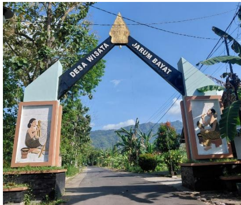
Gambar 2. 5 Gapura Desa Jarum