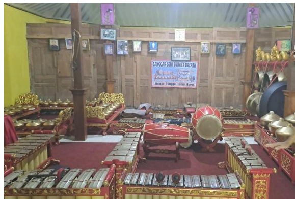
Gambar 2. 10 Seperangkat gamelan milik “Sunar Gamelan”