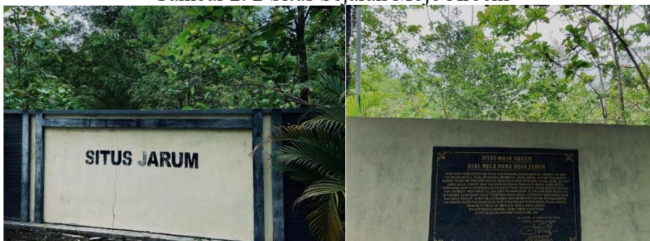
Gambar 2. 2 Situs Sejarah Mojo Aroem