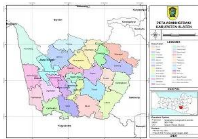
Gambar 2. 1 Peta Wilayah Kabupaten Klaten