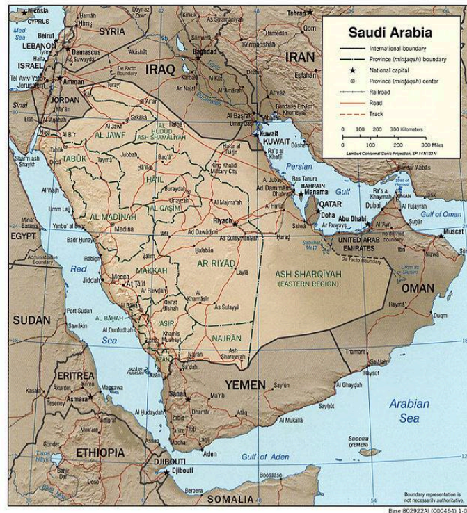
Gambar 2.1 Peta Geografis Arab Saudi

Negara ini memiliki wilayah yang sangat luas, yakni sekitar 2.150.000 km 2 dimana luasnya hampir menempati seluruh wilayah Jazira Arab (Hamdani, 2019). Secara demografis, jumlah penduduk yang menempati wilayah Arab tercatat mencapai sekitar 34.566.328 jiwa. Sementara, dari letak geografisnya Arab Saudi berbatasan langsung dengan beberapa negara yaitu Yordania, Irak, dan Kuwait di utara, Oman dan Yaman di wilayah selatan, timur dengan teluk persia, Uni Emirat Arab, Bahrain, dan Qatar, serta wilayah barat dengan Teluk Aqabah Laut Merah.