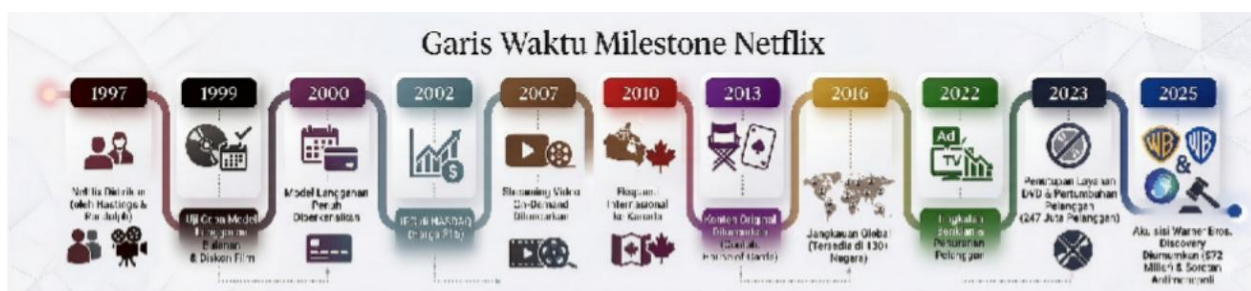
Gambar 2.1 Garis waktu netflix

Seiring dengan perkembangan tersebut Netflix mengembangkan model bisnis berbasis langganan (subscription video on-demand/VOD) yang menjadi sumber utama pendapatannya. Model ini memungkinkan pengguna mengakses berbagai konten dengan biaya bulanan tanpa bergantung pada iklan