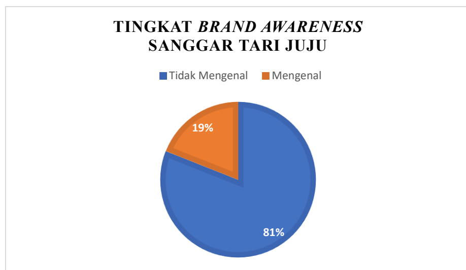
Gambar 1. 1 Tingkat brand awareness Sanggar Tari Juju

Sejalan dengan analisis kompetitor, kelemahan dalam digitalisasi informasi Sanggar Tari Juju menjadi salah satu faktor yang menghambat efektivitas branding . Keterbatasan media informasi menyebabkan masyarakat belum memperoleh akses informasi yang optimal mengenai Sanggar Tari Juju. Guna memvalidasi dampak dari keterbatasan media informasi tersebut, sebuah survei pra-produksi telah dilakukan untuk mengukur tingkat brand awareness Sanggar Tari Juju.