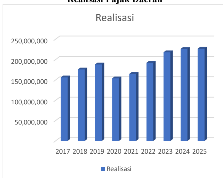
Gambar 4.3 Realisasi Pajak Daerah