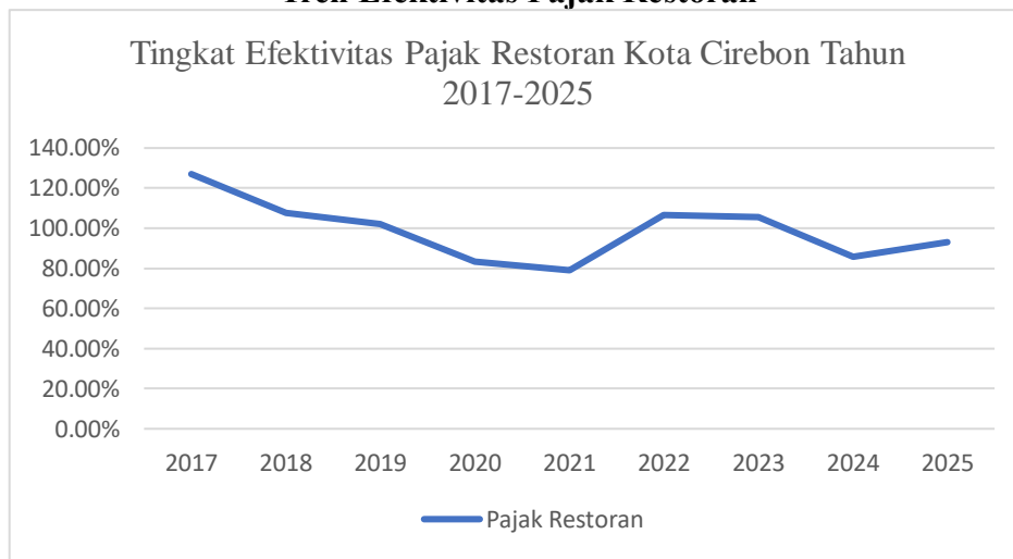
Gambar 4.4 Tren Efektivitas Pajak Restoran