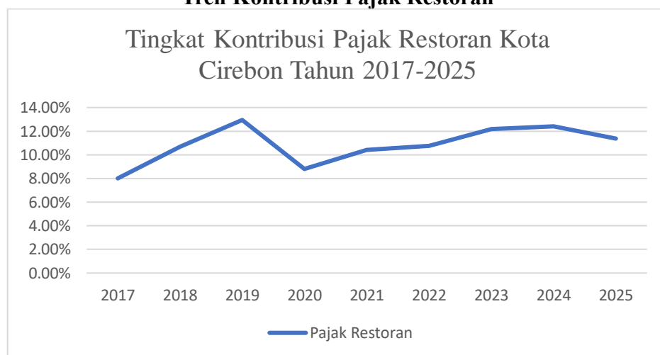
Gambar 4.5 Tren Kontribusi Pajak Restoran