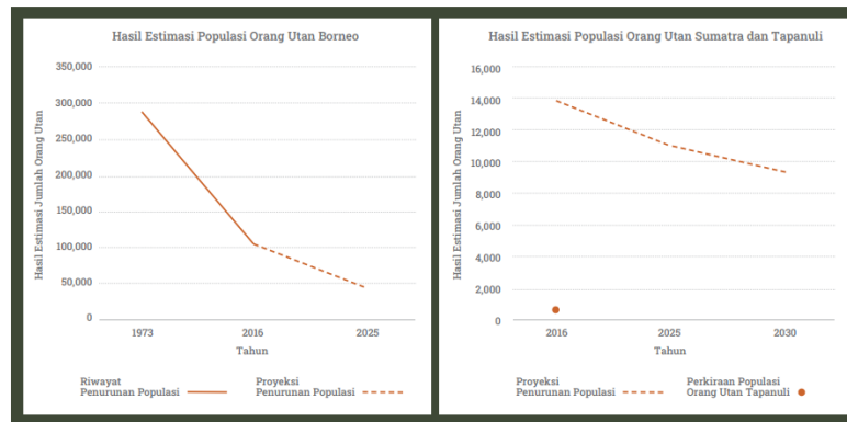
Gambar 1.2 Penurunan Populasi Orangutan di Indonesia