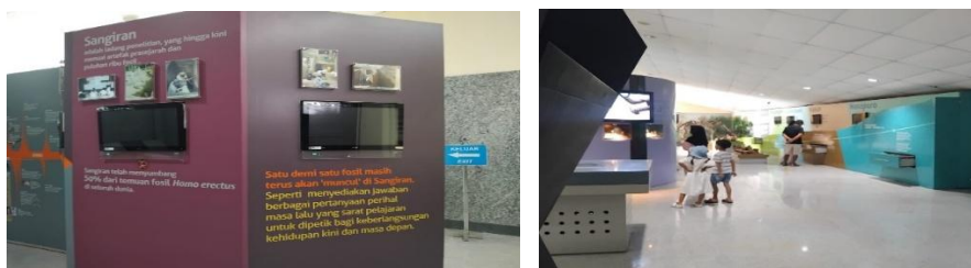
Gambar 2.6 Ruang Pamer 1 objek wisata Museum Dayu

Keberadaan objek wisata Museum Dayu tidak hanya menjadi destinasi kunjungan berwisata, tetapi juga menjadi sarana belajar sejarah dan budaya mengenai kehidupan manusia purba dari benda-benda peninggalannya. Museum Dayu mayoritas dikunjungi wisatawan dari kalangan pelajar, mulai dari anak-anak sekolah hingga mahasiswa karena objek wisata ini lebih menonjolkan konsep wisata edukasi yang berfokus pada pembelajaran sejarah dan budaya. Untuk dapat menikmati layanan wisata, biaya tiket masuknya sebesar Rp.5.000,- per orang dan jika wisatawan ingin mendapatkan layanan tambahan seperti layanan edukasi dan pemanduan maka harus membayar biaya tambahan. Objek wisata ini buka setiap hari Selasa sampai Minggu dari jam 08.00 wib dan tutup pada jam 16.00 wib serta tidak buka di hari Senin karena di hari tersebut digunakan untuk pemeliharaan museum.