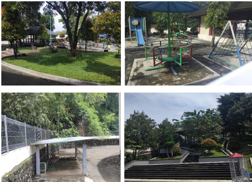
Gambar 2.7 Area taman, area bermain anak, jalur pejalan kaki, dan kebun binatang mini di objek wisata Museum Dayu

Dalam hal fasilitas dan infrastruktur, Museum Dayu dilengkapi dengan berbagai sarana penunjang yang dirancang untuk mendukung fungsi edukasi dan rekreasi. Fasilitas utama meliputi ruang pameran 1, satu ruang diorama, tiga ruang anjungan yaitu anjungan kabuh, notopuro, dan grenzbank yang menampilkan replika fosil, alat peraga interaktif, serta perangkat multi media yang menjelaskan kronologi kehidupan manusia purba. Selain itu, museum klaster ini juga dilengkapi area taman, area bermain anak, kebun binatang mini dengan koleksi rusa, jalur pejalan kaki, serta fasilitas pendukung seperti area parkir, toilet, dan pusat informasi pengunjung. Tata letak fasilitas dirancang sedemikian rupa dengan prinsip aksesibilitas untuk memastikan kenyamanan bagi pengunjung museum.