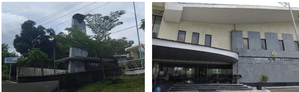
Gambar 2.3 Locket dan Pintu Masuk Museum Manusia Purba Klaster Dayu

Museum Manusia Purba Klaster Dayu atau lebih dikenal dengan nama “Museum Dayu” merupakan salah satu unit pengembangan yang terintegrasi dalam kawasan Situs Warisan Dunia UNESCO Sangiran Early Man Site . Sebagai bagian dari ekosistem wisata budaya dan edukasi, museum klaster ini memegang peranan strategis dalam pelestarian nilai-nilai paleoantropologi serta pengembangan pariwisata berkelanjutan di Kabupaten Karanganyar, Provinsi Jawa Tengah. Museum Dayu mulai dibangun pada tahun 2013 dan resmi dibuka oleh Wakil Presiden Republik