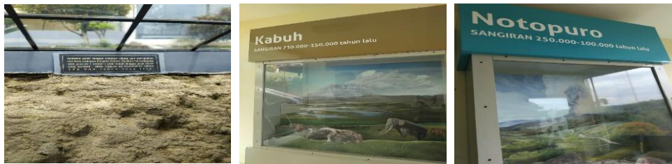
Gambar 2.5 Lapisan tanah, ruang anjungan kabuh, dan ruang anjungan notopuro di objek wisata Museum Dayu