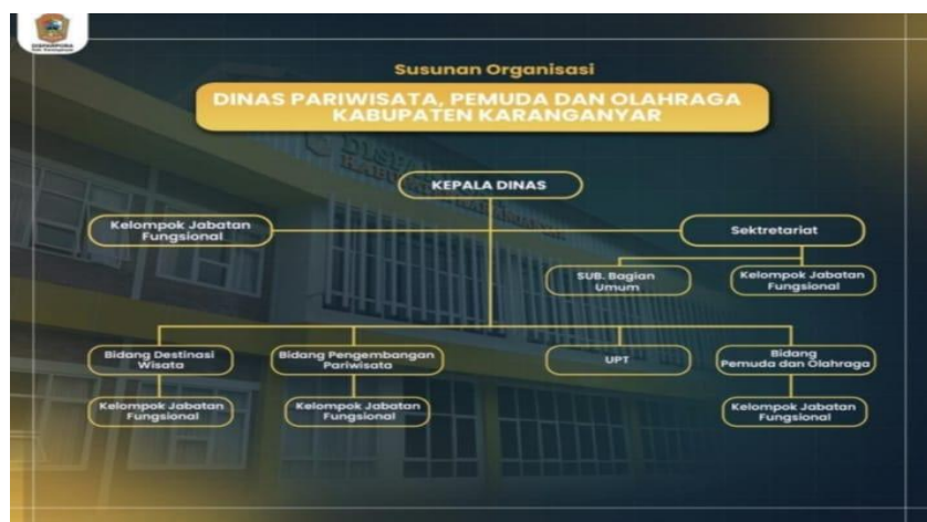
Gambar 2.2 Struktur Organisasi Disparpora Kabupaten Karanganyar