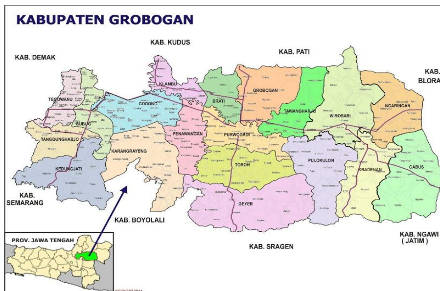
Gambar 2. 1 Peta Kabupaten Grobogan