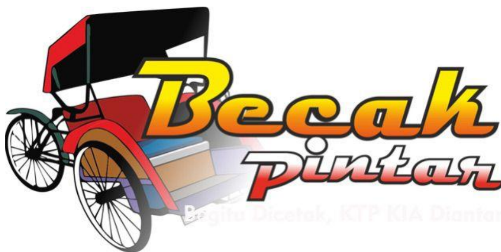
Gambar 2. 3 Becak Pintar