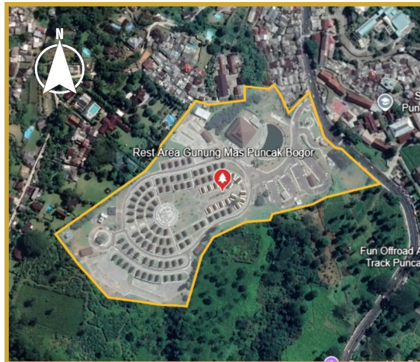
Gambar 2. 6 Peta Rest Area Gunung Mas

Kawasan Puncak, tetapi juga sebagai ruang rekreasi yang menawarkan panorama alam.