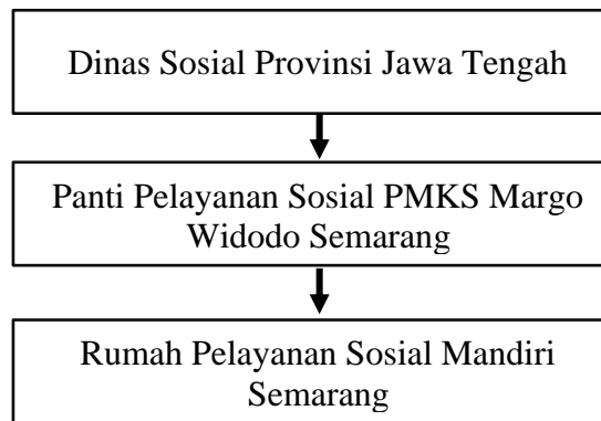
Gambar 2. 1 Rantai Kierarki Kelembagaan Rumah Pelayanan Sosial Mandiri