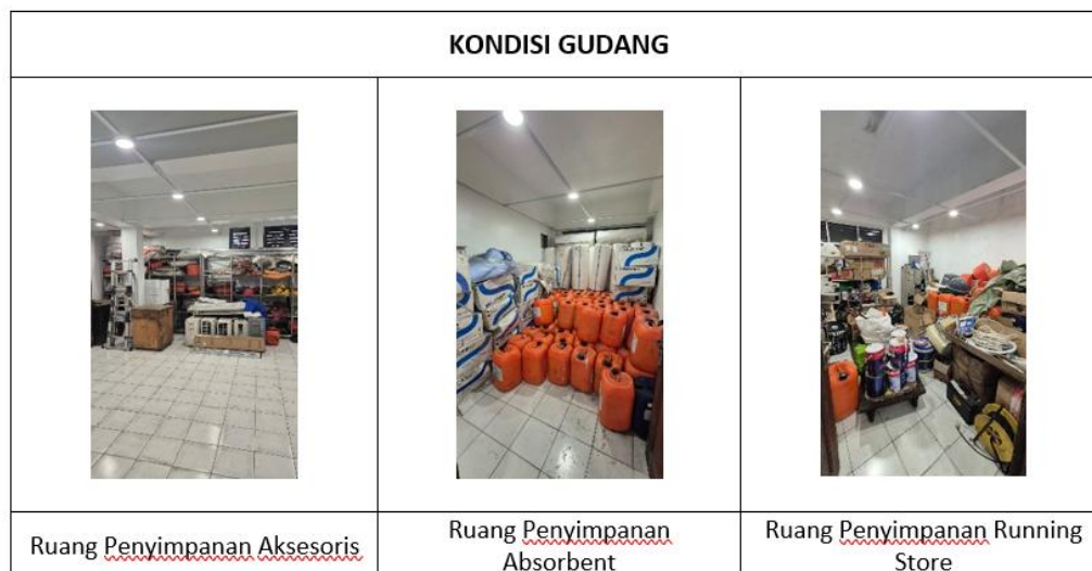
Gambar 1. 3 Kondisi Ruang Gudang Penyimpanan Peralatan OSR di Pertamina Port Jakarta

Pada observasi awal di Gudang Pertamina Port Jakarta , gudang tersebut terindikasi bahwa tata letak penyimpanan aksesoris peralatan oil spill response belum sepenuhnya optimal, seperti yang disampaikan oleh Gu et al., (2010) dalam mendukung kemudahan akses dan mobilisasi peralatan. Pada kegiatan tersebut menemukan bahwa masih terdapat barang yang belum dikategorikan secara sistematis serta belum tersedia pelabelan yang jelas pada lokasi penyimpanan. Kondisi tersebut berpotensi menimbulkan kesulitan bagi pekerja dalam proses pencarian dan pengambilan barang secara cepat, terutama ketika peralatan dibutuhkan dalam situasi tanggap darurat. Kondisi ini juga tidak sejalan dengan kerangka Tier 1 yang mensyaratkan respons cepat dari operator fasilitas. Oleh karena itu, evaluasi terhadap tata letak gudang peralatan OSR bukan sekadar isu efisiensi operasional melainkan isu strategis di lingkungan perusahaan.