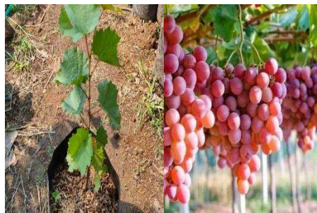
Ilustrasi 1. Anggur Varietas Red master

Anggur termasuk dalam tumbuhan merambat yang berbiji dikotil. Anggur merupakan tanaman dikotil atau biji berkeping dua dengan daun berbentuk jantung