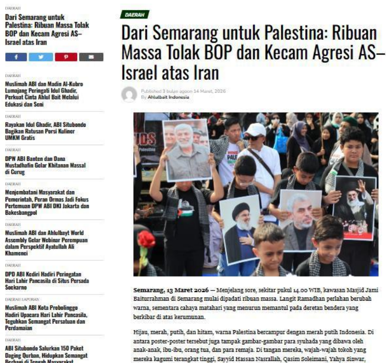
Gambar 2.1 Aksi Massa Lintas Elemen Masyarakat Sipil di Semarang

Dinamika perlawanan makro kemasyarakatan ini tidak hanya berhenti di ruang digital, melainkan mewujud dalam mobilisasi massa nyata di tingkat daerah. Sebagai contoh nyata di wilayah Jawa Tengah, gerakan solidaritas makro yang dimotori oleh elemen keagamaan seperti Ahlulbait Indonesia secara konsisten mengkonsolidasikan ribuan massa sipil di Kota Semarang pada pertengahan Maret tahun 2026 (Ahlulbait Indonesia, 2026). Gerakan ini secara tegas mengeluarkan pernyataan sikap di depan publik untuk menolak segala bentuk kompromi ekonomi dan mengecam keikutsertaan dalam forum internasional seperti Board of Peace (BoP) yang dinilai mengabaikan hak-hak dasar kemerdekaan bangsa Palestina.