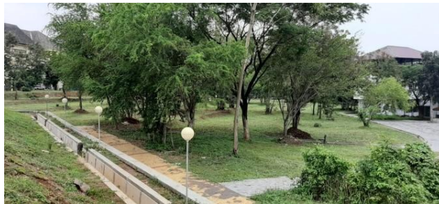
Gambar 2.2 Ruang Terbuka Hijau