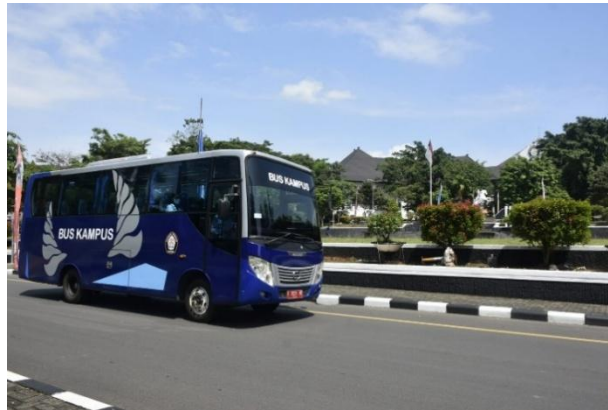
Gambar 2.3 Bus kampus Undip

harus menggunakan kendaraan. Bus kampus ini hadir sebagai solusi transportasi yang nyaman, ramah lingkungan, dan bebas biaya bagi para mahasiswa dan dosen.