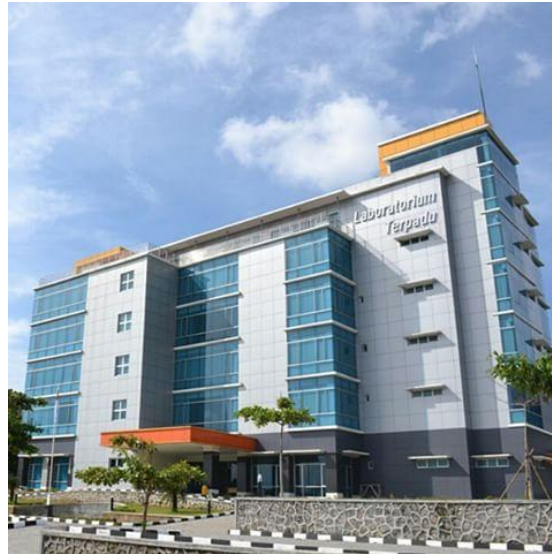
Gambar 2.4 Lab Terpadu Undip

Fasilitas-fasilitas tersebut tidak hanya mendukung kegiatan akademik, tetapi juga menjadi bukti nyata dari komitmen Undip dalam mewujudkan lingkungan kampus yang berkelanjutan dan ramah lingkungan.