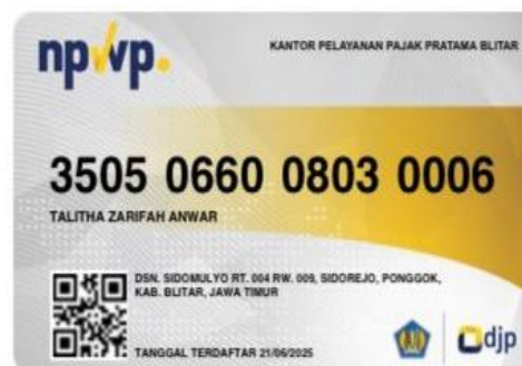
Gambar 2.3 Nomor Pokok Wajib Pajak

Secara legal, SewoApp beroperasi sebagai usaha rintisan yang telah memiliki Nomor Induk Berusaha (NIB) sebagai dasar legalitas formal. NIB SewoApp adalah 0803250014584, yang diterbitkan melalui sistem perizinan berusaha terintegrasi secara elektronik, dan Nomor Pokok Wajib Pajak (NPWP) dengan nomor 3505066008030006 Status legalitas ini menunjukkan bahwa SewoApp telah tercatat sebagai pelaku usaha yang sah dan memenuhi persyaratan administratif dasar untuk menjalankan kegiatan usaha di bidang jasa penyedia platform digital. Keberadaan NIB sekaligus menjadi salah satu faktor pendukung kredibilitas SewoApp di mata mitra rental maupun pengguna, karena mencerminkan komitmen usaha terhadap kepatuhan regulasi dan tata kelola yang baik.