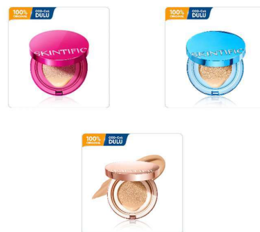
Gambar 2. 8 Produk Cushion

Cushion merupakan produk alas bedak berbentuk compact dengan tekstur cair yang diaplikasikan menggunakan bantalan khusus. Produk ini dirancang untuk memberikan hasil riasan yang praktis, merata, dan tampak natural hingga penuh, tergantung pada jenis dan formulasi yang digunakan. Skintific menghadirkan berbagai varian cushion dengan hasil akhir dan tingkat coverage yang disesuaikan dengan kebutuhan kulit konsumen.