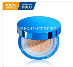
Gambar 2. 11 Produk Loose Powder