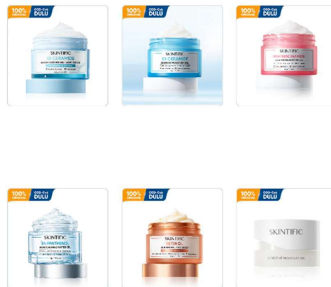
Gambar 2. 2 Produk Moisturizer

Penggunaan moisturizer secara rutin dapat membantu mencegah kulit kering, mengurangi iritasi, serta mendukung kesehatan kulit secara keseluruhan. Skintific menghadirkan berbagai pilihan moisturizer dengan kandungan aktif dan tekstur yang disesuaikan dengan kebutuhan serta jenis kulit yang berbeda-beda.