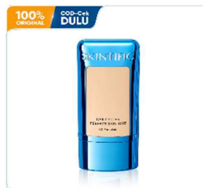
Gambar 2. 9 Produk Skin Tint

Skin tint merupakan produk complexion dengan tekstur ringan yang diformulasikan untuk memberikan tampilan kulit yang lebih natural dan segar. Produk ini berfungsi membantu meratakan warna kulit secara ringan tanpa memberikan kesan tebal seperti foundation , sehingga cocok digunakan untuk aktivitas sehari-hari dengan hasil akhir yang tampak alami.