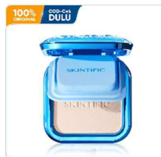
Gambar 2. 10 Produk Powder Foundation

Powder foundation merupakan alas bedak berbentuk padat atau bubuk yang digunakan untuk meratakan warna kulit sekaligus membantu menyerap minyak berlebih. Produk ini memberikan coverage yang lebih tinggi dibandingkan bedak biasa.