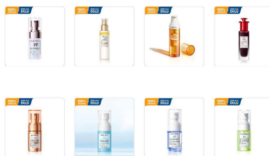
Gambar 2. 5 Produk Serum

Penggunaan serum secara rutin dapat membantu meningkatkan efektivitas perawatan kulit, seperti mencerahkan, menghidrasi, memperbaiki tekstur, serta mengatasi tanda penuaan. Skintific menyediakan beragam varian serum dengan fungsi yang berbeda sesuai kebutuhan kulit konsumen.