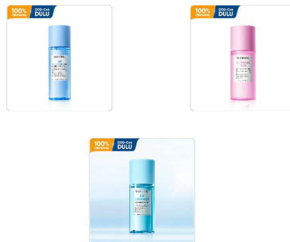
Gambar 2. 7 Produk Toner