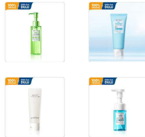
Gambar 2. 6 Produk Cleanser