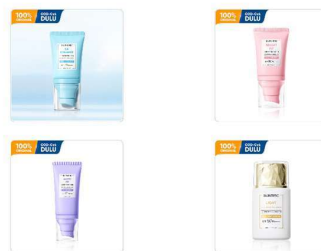
Gambar 2. 3 Produk Suncare

Penggunaan suncare secara rutin sangat penting sebagai langkah perlindungan kulit sehari-hari. Skintific menyediakan berbagai pilihan suncare dengan tekstur dan manfaat tambahan yang disesuaikan dengan kebutuhan konsumen.