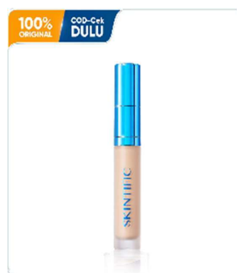
Gambar 2. 12 Produk Concealer

Concealer merupakan produk makeup yang digunakan untuk menyamarkan ketidaksempurnaan pada wajah, seperti noda hitam, bekas jerawat, dan area gelap. Produk ini memiliki tekstur dan tingkat coverage yang lebih tinggi dibandingkan foundation , sehingga efektif dalam memberikan hasil riasan yang lebih merata.