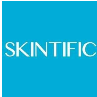
Gambar 2. 1 Logo Skintific

dengan huruf kapital yang menyatukan dengan warna biru melambangkan kesegaran, kebersihan, dan ketenangan.