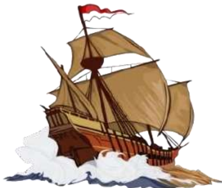
Gambar 4.1 Logo Perusahaan Sumber : Data Perusahaan, 2025