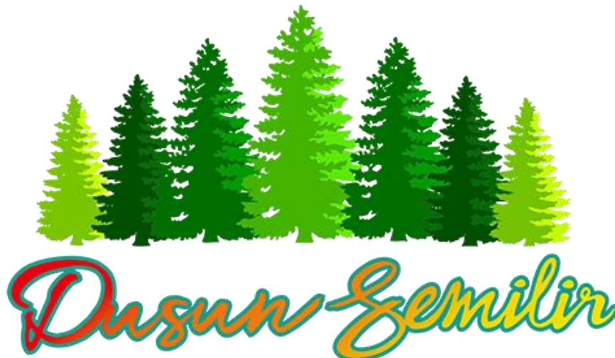
Gambar 2. 1 Logo Dusun Semilir