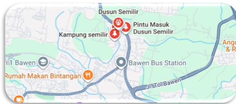
Gambar 2. 3 Peta Lokasi Dusun Semilir

Jawa serta lingkungan permukiman dan lahan pertanian masyarakat. Adapun di sebelah selatan, terdapat destinasi wisata Eling Bening yang menawarkan panorama Rawa Pening dari ketinggian.