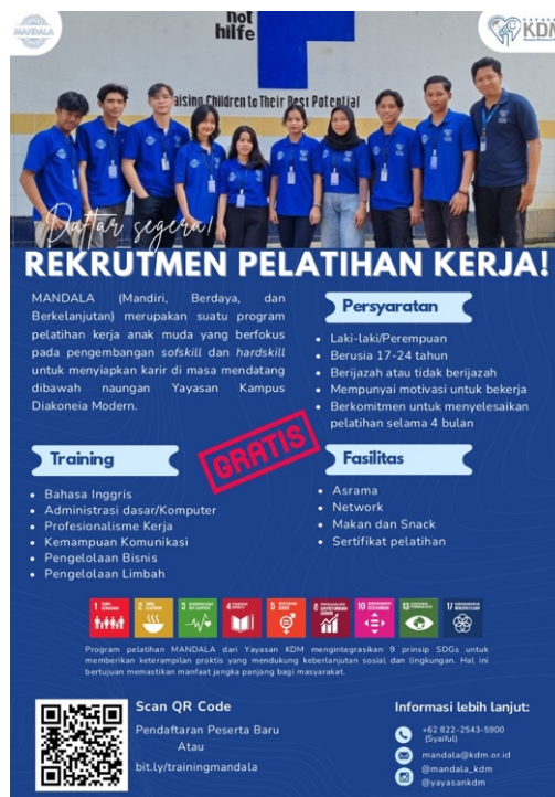
Gambar 1.2 Brosur Program Mandala

Sequence Guide (SSG) sebagai pedoman dalam pengelolaan konten sehingga efektivitas komunikasi kepada audiens belum maksimal.