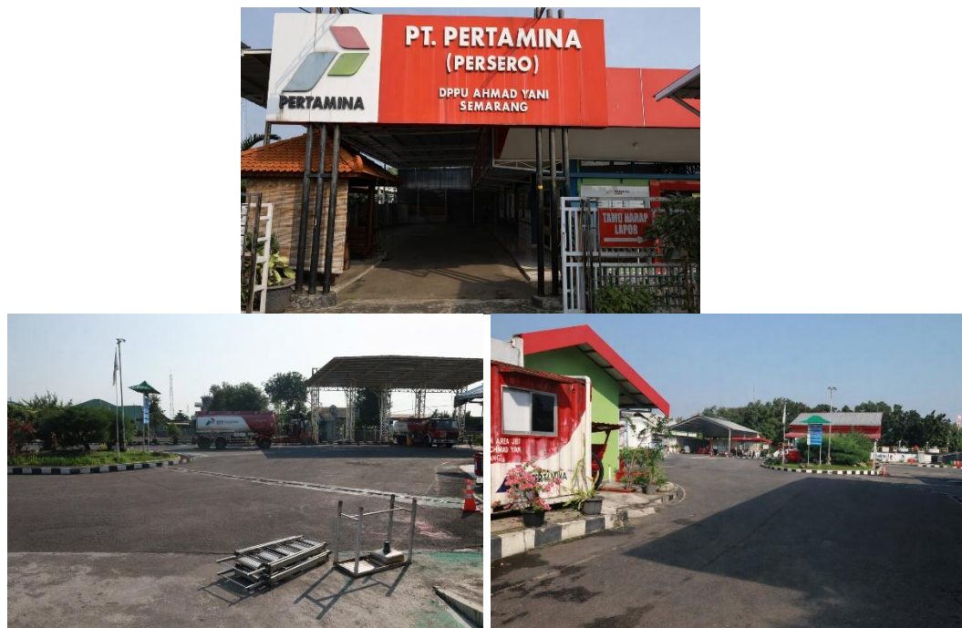
Gambar 2. 1 PT Pertamina AFT Ahmad Yani