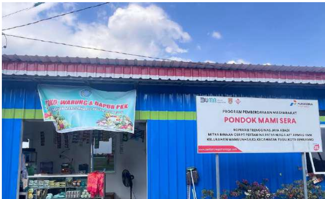
Gambar 2. 5 Kondisi dari Pondok MAMI SERA di Kelurahan Mangunharjo

(CSR). Program ini mulai dilaksanakan sejak tahun 2022 dengan fokus utama untuk memberikan solusi terhadap berbagai permasalahan sosial dan ekonomi yang dihadapi masyarakat di Kelurahan Mangunharjo.