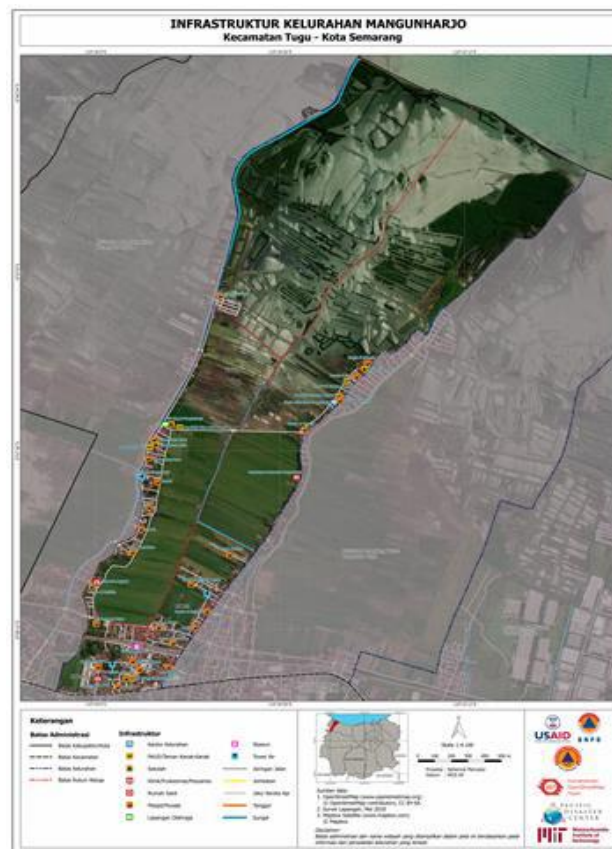
Gambar 1. 4 Peta Lokasi Penelitian

dalam kelompok dalam konteks UMKM di Indonesia, terutama yang melibatkan program CSR dari perusahaan besar. Kesenjangan penelitian ini mengindikasikan bahwa pemahaman mengenai mekanisme peningkatan kapasitas wirausaha UMKM masih belum komprehensif. Oleh karena itu, penelitian ini menjadi sangat urgensi untuk mengisi kekosongan tersebut, dengan tujuan untuk memberikan pemahaman yang lebih mendalam mengenai bagaimana partisipasi dalam kelompok dapat mempengaruhi efektivitas pelatihan dan pendampingan dalam meningkatkan kapasitas wirausaha UMKM.