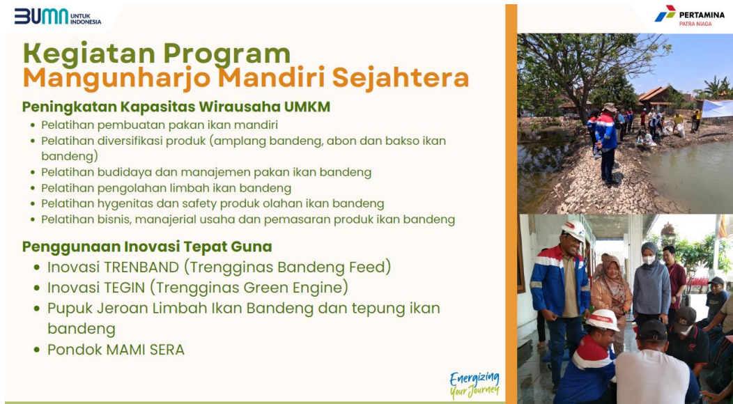
Gambar 1. 2 Rincian Kegiatan Program MAMI SERA

dirancang untuk memperkuat kemandirian, meningkatkan kesejahteraan, serta mendorong keberlanjutan ekonomi masyarakat pesisir.