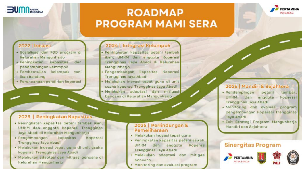
Gambar 1. 3 Kegiatan Roadmap Program MAMI SERA

keamanan produk, manajemen operasional, dan strategi pemasaran modern. Program ini juga mendukung pembentukan Pondok MAMI SERA sebagai pusat kegiatan, memfasilitasi interaksi dan kolaborasi antar-pelaku UMKM. Temuan dari hasil observasi lapangan di lokasi penelitian yaitu di PONDOK MAMI SERA mengindikasikan bahwa pelatihan dan pendampingan yang sistematis dan terarah dari PT Pertamina Patra Niaga diperkirakan memiliki potensi signifikan dalam meningkatkan kapasitas wirausaha UMKM di Kelurahan Mangunharjo. Namun demikian, keberhasilan peningkatan kapasitas tersebut tidak dapat dilepaskan dari tingkat partisipasi aktif para pelaku UMKM. Partisipasi ini memiliki peran strategis, baik sebagai elemen sistem yang saling berhubungan maupun sebagai kontribusi individu yang memengaruhi dinamika pengembangan.