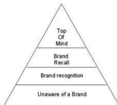
Gambar 2. 2 Piramida Brand Awareness

Tingkatan kesadaran merek secara hierarkis digambarkan oleh David Aaker dalam konsep Brand Awareness Pyramid . Piramida ini menjelaskan evolusi kognitif konsumen terhadap sebuah merek, mulai dari kondisi tidak tahu sama sekali hingga menjadi merek yang paling diingat.