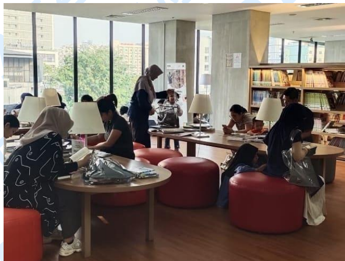
Gambar 1. 2 Kondisi Perpustakaan Jakarta di Cikini

Dalam menghadapi tantangan tersebut, beberapa perpustakaan melakukan upaya revitalisasi untuk meningkatkan daya tarik kunjungan masyarakat. Salah satu contohnya adalah program revitalisasi perpustakaan yang dilakukan oleh Dinas Kearsipan dan Perpustakaan Provinsi Jawa Tengah. Perpustakaan tersebut melakukan perluasan gedung perpustakaan dan menyediakan ruang parkir yang lebih memadai di lantai 1. Program tersebut bertujuan untuk meningkatkan minat baca masyarakat dan memenuhi kebutuhan masyarakat akan perpustakaan yang lebih memadai dan ruang interaksi masyarakat yang lebih modern (Dinas Arpus Provinsi Jawa Tengah, 2024).