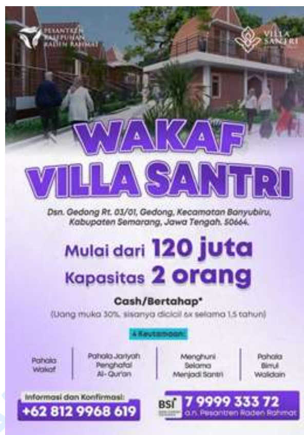
Gambar 15. Poster Wakaf Villa Santri

santri, mengakses bangunan kapan saja, dan mengatur interior rumah lumbung sesuai keinginan mereka.