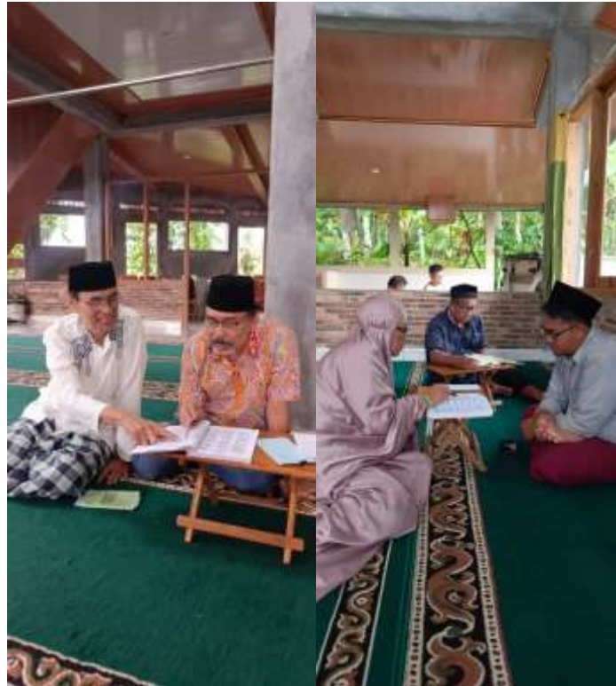
Gambar 28. Foto kiri: Salah seorang santri lansia sedang dibantu oleh santri lain