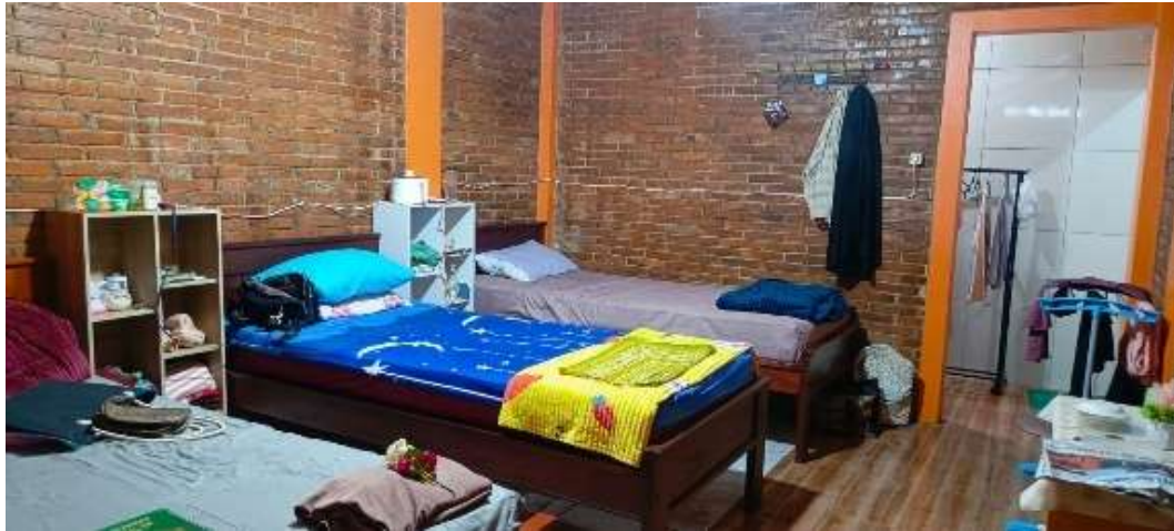
Gambar 16. Kondisi di dalam asrama lansia

dispenser sehingga kebutuhan air minum dapat diambil dari dapur umum pesantren atau membeli sendiri galon air.