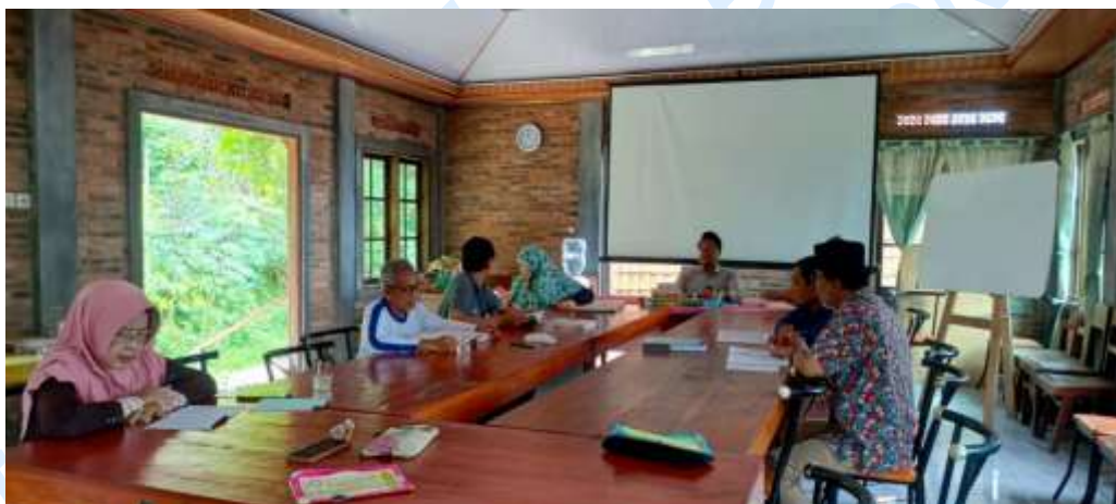
Gambar 27. Suasana di kelas mengaji

Dalam pelaksanaan kelas mengaji, santri membaca secara bergiliran sekitar tujuh menit di hadapan guru, dan sesuai kemampuan masing-masing. Beberapa santri masih membaca buku “Metode Praktis Belajar Membaca Al-Qur’an Tingkat 1” sementara santri lain sudah membaca Al-Qur’an. Selama proses membaca, Pak Ustadz memperhatikan bacaan dan memberikan koreksi apabila terdapat kesalahan dalam pelafalan atau tajwid. Setiap bacaan yang telah diselesaikan kemudian dicatat dalam kartu catatan milik santri. Tanda paraf diberikan sebagai penanda bahwa bacaan telah dibaca dan diperiksa. Sistem ini menjadi alat evaluasi pembelajaran dan kontrol untuk santri agar dapat disiplin dan bertanggung jawab terhadap proses belajar mengaji mereka.