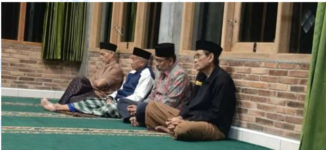
Gambar 22. Santri lansia mendengar kajian di waktu subuh