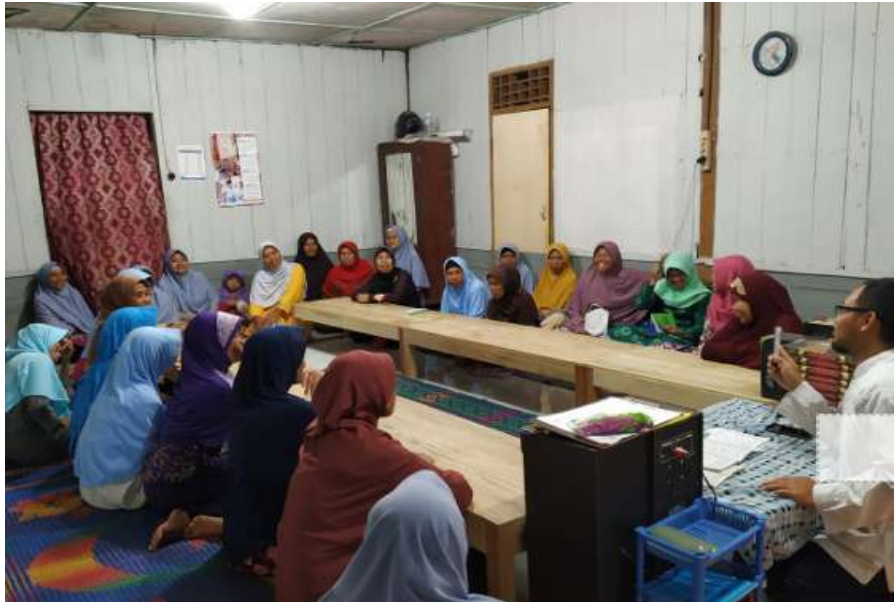
Gambar 1. Taman Pendidikan Al-Qur'an (TPQ) untuk lansia (2018)

delapan orang ibu-ibu lansia dari lingkungan sekitar. Seiring waktu jumlah santri meningkat dan kegiatan belajar mengaji bersama menjadi kegiatan rutin untuk lansia sekitar.