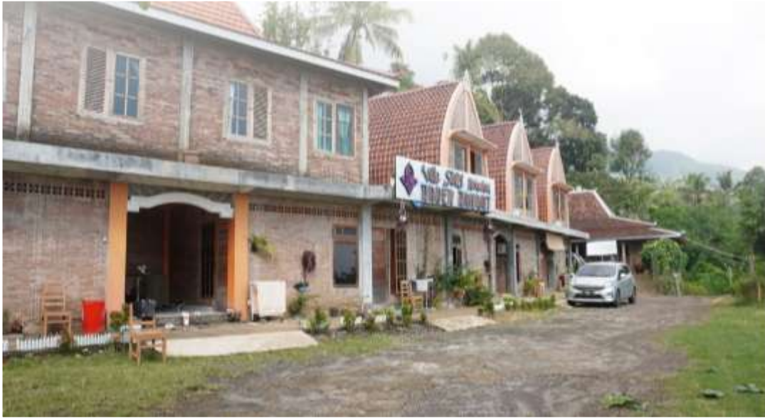
Gambar 6. Pesantren Kasepuhan Raden Rahmat