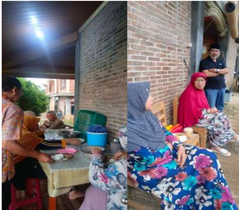
Gambar 23. Foto kiri: lansia sedang sarapan bersama di meja makan