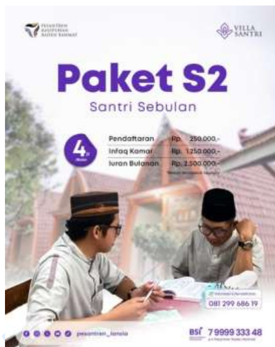
Gambar 11. Poster Paket S2 (Santri Sebulan)

bersih dari sumur bor dan pipanisasi, serta lingkungan yang relatif tenang dan asri untuk mendukung ketenangan batin. Berikut gambar poster dan penjelasan dari setiap program mukim yang ditawarkan oleh PPKRR.