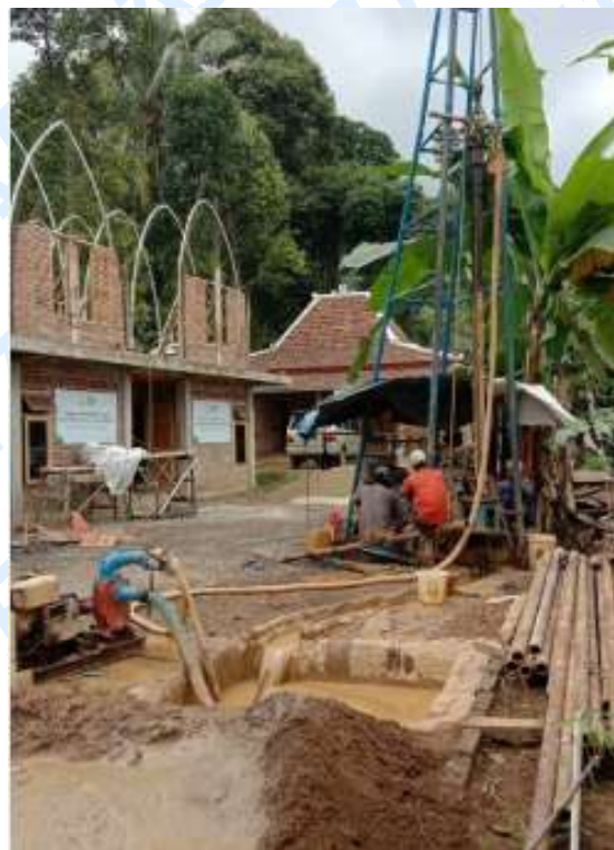
Gambar 4. Proses menggali mata air (2018)

Ketika pesantren mulai membangun lahan setelah proses babat alas , kebutuhan air meningkat drastis untuk keperluan pembangunan fisik serta kebutuhan harian santri seperti mandi, memasak, mencuci, dan berwudhu. Namun ketersediaan air belum memadai, sehingga sempat terjadi kesulitan distribusi air dan penggunaan harus sangat dihemat. Berkat dukungan dari berbagai organisasi seperti Pesantren Isy Karima, ACT, dan Radio Suara Muslim Surabaya, serta relawan nasional dari berbagai daerah, PKRR berhasil membangun empat sumber mata air mandiri melalui pipanisasi sepanjang 3,5 km.