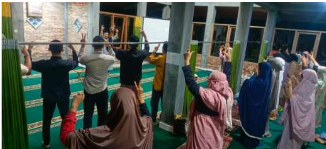
Gambar 8. Senam Motorik di waktu subuh