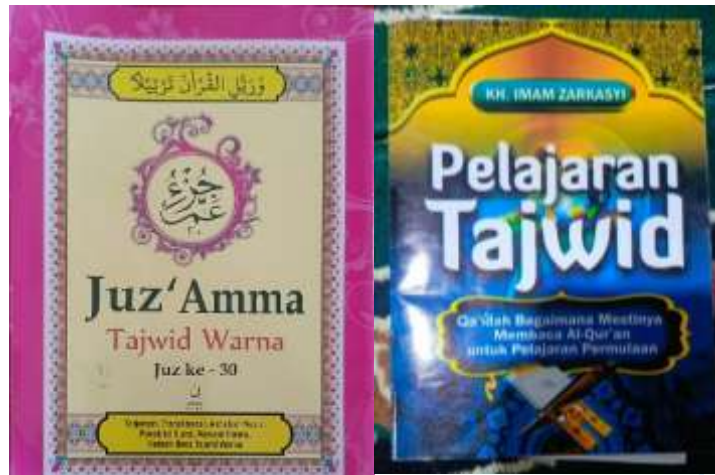
Gambar 18. Kiri: Buku “Juz’ Amma” dan Buku “Pelajaran Tajwid”