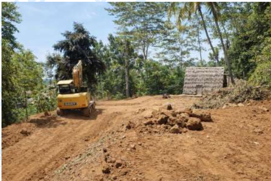
Gambar 3. Proses babat alas di Desa Gedong

Desa Gedong berada di ketinggian 800 meter di atas permukaan laut dan dikelilingi hutan. Hal ini membuat proses pembangunan pesantren dan perekrutan calon santri dapat menjadi lebih sulit. Ide pembangunan ini sempat dianggap tidak akan berhasil oleh banyak warga. Meskipun begitu, Winarno dan timnya melakukan babat alas yang didukung oleh donasi dari berbagai sumber, seperti jamaah atau simpatisan, sumbangan masyarakat sekitar, dan dana swadaya internal yayasan. Usaha tersebut menghasilkan pembangunan jalan beraspal yang memungkinkan akses ke pesantren.