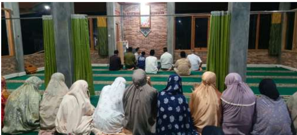
Gambar 9. Salat berjamaah di Mesjid Al-Karimiyah