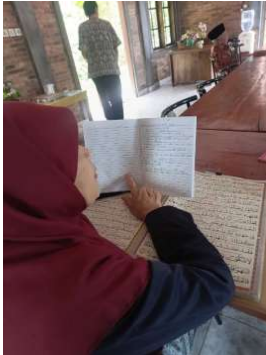
Gambar 20. Seorang santri lansia sedang belajar dengan Al-Qur'an berukuran besar