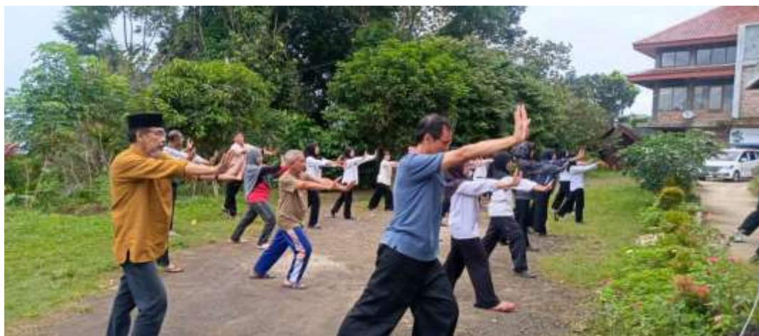
Gambar 25. Kegiatan senam pagi bersama