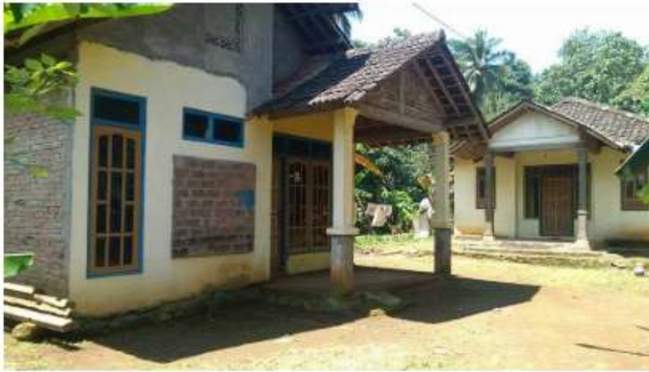
Gambar 2. Asrama santri pertama di PPKRR