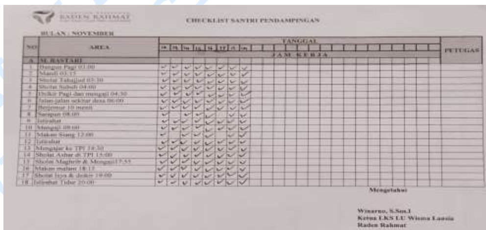
Gambar 30. Contoh Jadwal Harian Santri

Pada hari-hari tertentu, ada kegiatan pembelajaran tambahan di sore hari setelah salat Asar. Kelas fikih diadakan pada hari Senin, kelas fafsir diadakan pada hari Rabu, dan kelas Hadist diadakan pada hari Kamis. Kegiatan sehari-hari dicatat dalam tabel jadwal kegiatan harian para santri untuk monitoring kegiatan setiap santri.