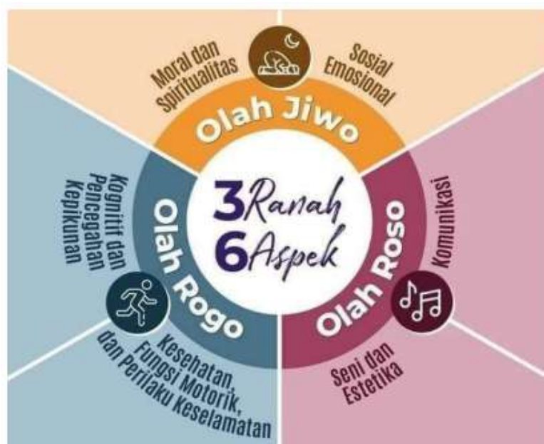
Gambar 7. Kurikulum Rojiro