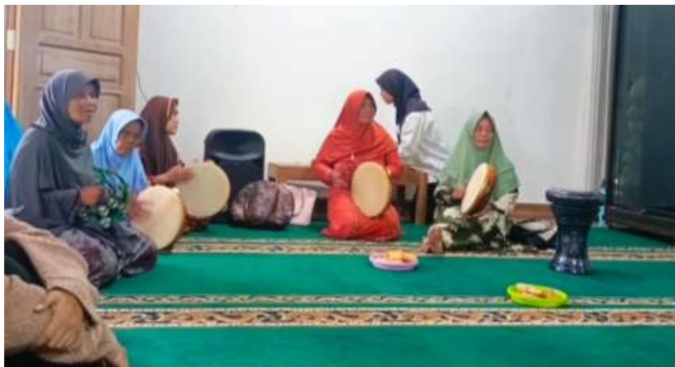
Gambar 10. Kegiatan selawatan oleh ibu-ibu santri nonmukim