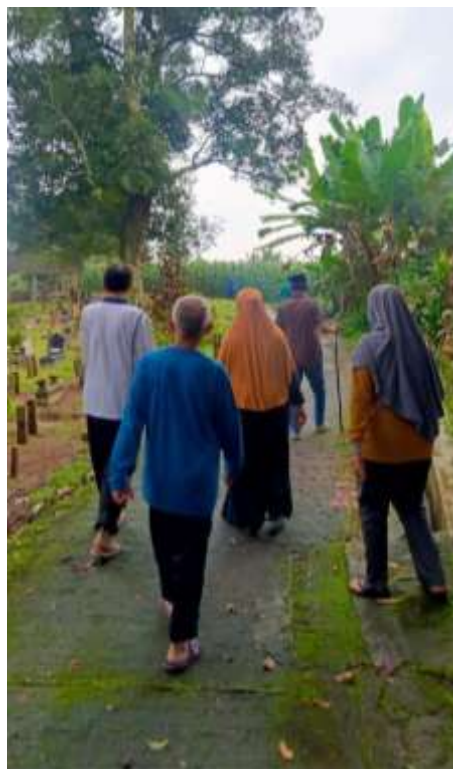
Gambar 26. Kegiatan jalan santai di pagi hari