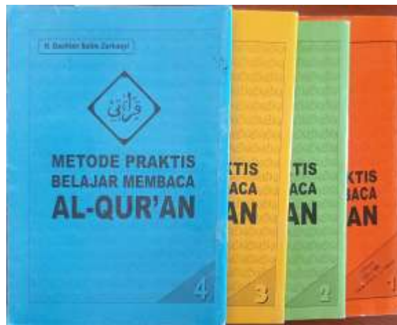
Gambar 17. Buku “Metode Praktis Belajar Membaca Al-Qur’an tingkat 1-4”

hingga membaca ayat secara utuh. Di dalam kelas, pembelajaran tidak diseragamkan, melainkan disesuaikan dengan kapasitas individu santri lansia. Sistem belajar membaca di kelas dilakukan dengan mengantre membaca buku di depan guru sehingga santri yang belum mendapat bagian untuk menghadap guru bisa berlatih dengan santri lain terlebih dahulu. Buku metode belajar ini harus dikembalikan setelah santri menyelesaikan program mukimnya.