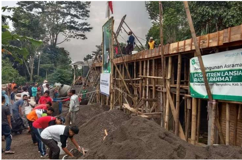
Gambar 5. Pembangunan Asrama PPKRR

organisasi dan melibatkan sebanyak 350 relawan dari berbagai daerah. Akhirnya PPKRR dan 120 keluarga sekitar mendapat manfaat dari dukungan ini, hal ini membuat respon warga menjadi mendukung sepenuhnya pembangunan PPKRR. Seiring waktu, dukungan publik terus mengalir, para dermawan dari berbagai daerah menyumbangkan dana untuk pembangunan PPKRR baik secara daring atau luring. Pada 2019 dilakukan peletakan batu pertama Masjid Al-Karimiyah. Pada 2021, PPKRR