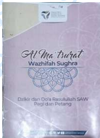
Gambar 19. Buku zikir “Al Ma’Tsurat”

Buku “Pelajaran Tajwid” dapat diakses melalui rak buku yang ada dikelas dan ditujukan sebagai panduan bagi santri yang telah mampu membaca Al-Qur’an. Selanjutnya terdapat buku zikir pagi dan petang yang dibaca secara rutin setelah salat subuh dan salat zuhur. PPKRR menyediakan buku bacaan zikir terbitan Yayasan Pitutur Luhur dan buku ini disediakan di rak buku yang ada di Masjid Al-Karimiyah sehingga santri bisa langsung mengambil buku zikir setelah salat berjamaah.