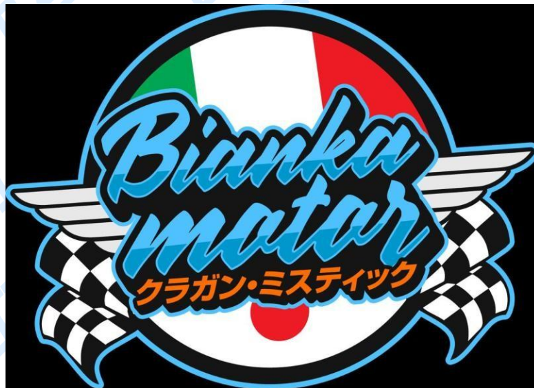
Gambar 2. 1 Logo Komunitas Bianka Motor

Kelompok Bianka Motor mengawali perjalanannya dengan identitas ganda yang saling melengkapi, yakni beroperasi sebagai tim balap sekaligus bengkel modifikasi spesialis motor balap. Sejarah kelompok ini mulai ditelusuri sejak Agustus 2016, ketika pendirinya yang merupakan mekanik jebolan VMR Mekanik Berdasi Jogja merintis usaha otomotif ini. Kompetensi teknis mendalam dari pendidikan tersebut menjadi fondasi utama identitas Bianka Motor. Kegiatan operasional utamanya memang berfokus pada persiapan motor untuk kompetisi, namun bengkel ini tetap membuka pintu untuk layanan service umum harian bagi masyarakat luas pada masa-masa jeda atau saat tidak ada jadwal balapan.