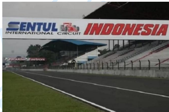
Gambar 2. 3 Sirkuit Internasional Sentul