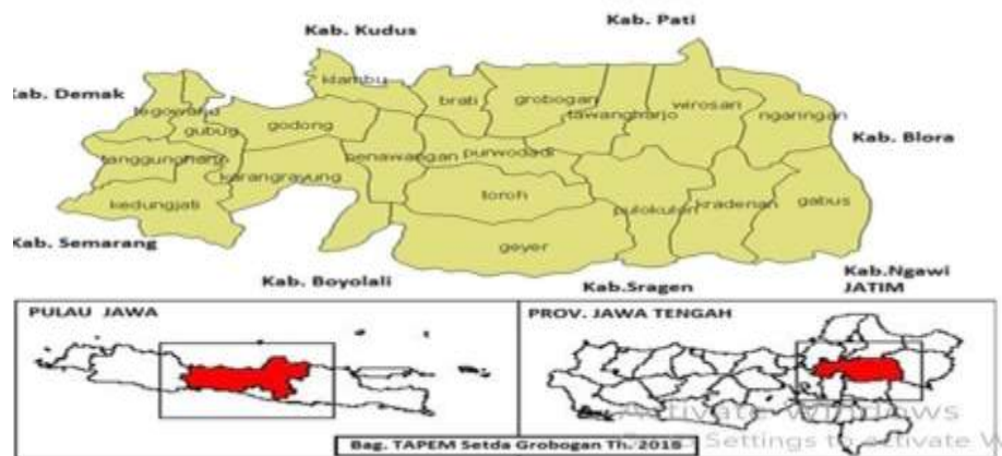
Peta Kabupaten Grobogan