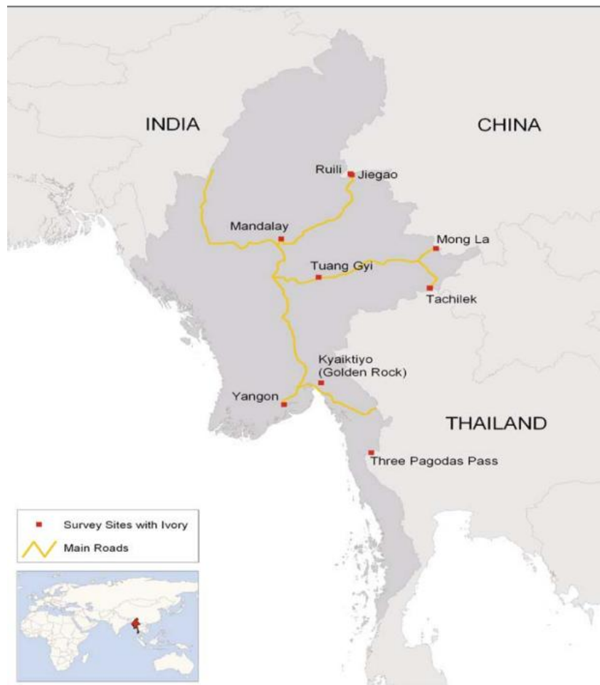
Gambar 2. 1 Jalur perdagangan satwa liar ilegal di Myanmar

restoran daging liar, serta toko khusus satwa liar. Hal ini dikarenakan Myanmar dan Tiongkok memiliki perbatasan panjang yang rawan terhadap penyelundupan, hubungan ekonomi yang kuat, serta banyaknya praktik korupsi, menjadikan Myanmar sebagai pintu masuk utama bagi berbagai spesies satwa liar ilegal menuju Tiongkok (Nijman et al, 2015).