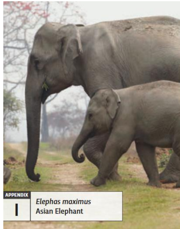
Gambar 2.5 Asian elephants atau gajah Asia yang tercantum dalam Appendix 1 CITES.

mencapai sekitar US$800, dimana angka ini lebih tinggi dari tahun sebelumnya yang berjumlah sekitar 6.841 (Vigne & Nijman, 2022).