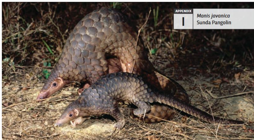
Gambar 2.4 Manis javanica atau trenggiling sunda yang tercantum dalam Appendix 1 CITES.