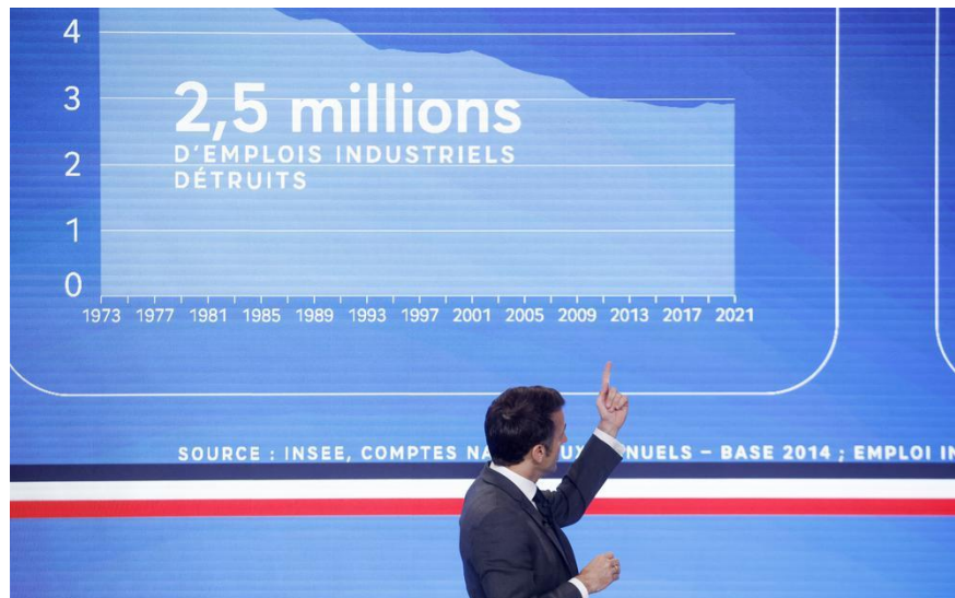
Gambar 1. 1. Emmanuel Macron menerangkan rancangan kebijakan untuk menahan merosotnya ekonomi Prancis melalui pidatonya di Paris, 11 Mei 2023.

harus dapat mempertahankan diri dalam kompetisinya dengan negara-negara industri besar tersebut.