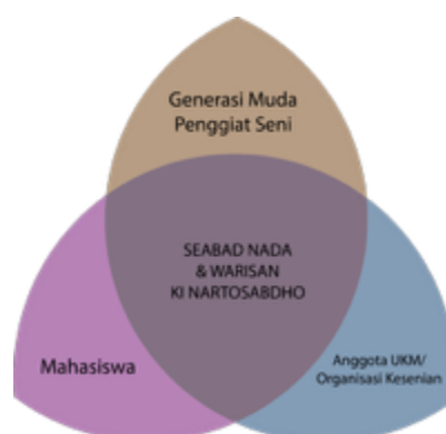
Gambar 1. 3 Segmentasi