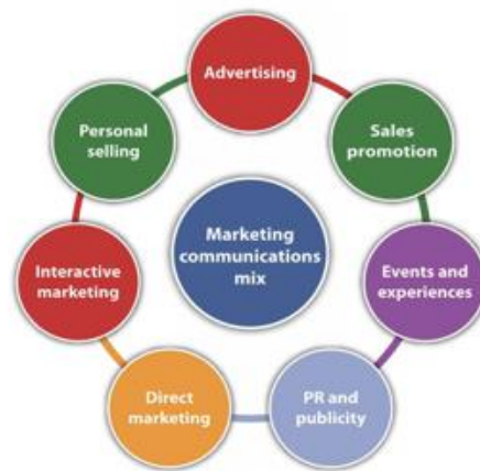
Gambar 1. 2 IMC Mix

promotion ) untuk memberikan stimulus atau insentif partisipasi, pemasaran langsung ( direct marketing ) untuk interaksi personal, pemasaran interaktif ( interactive marketing ) untuk komunikasi dua arah melalui media digital atau tatap muka, serta acara dan pengalaman ( events and experiences ) untuk memberikan pengalaman langsung yang berkesan. Dengan integrasi semua elemen ini, IMC tidak hanya menyebarkan informasi, tetapi juga meningkatkan kesadaran, pemahaman, dan keterlibatan audiens terhadap brand atau kegiatan yang dijalankan (Safitri, t.t.).