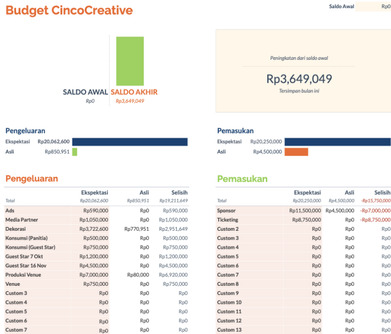
Gambar 1.6 Budgeting