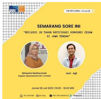
Gambar 1.2: Poster Diskusi “Refleksi 39 Tahun Ratifikasi Konvensi CEDAW di Jawa Tengah