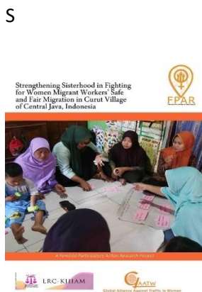
Gambar 1.1: Sampul Buku “Strengthening Sisterhood in Fighting for Women Migrant Workers’ Safe and Fair Migrations in Curut Village of Central Java, Indonesia”