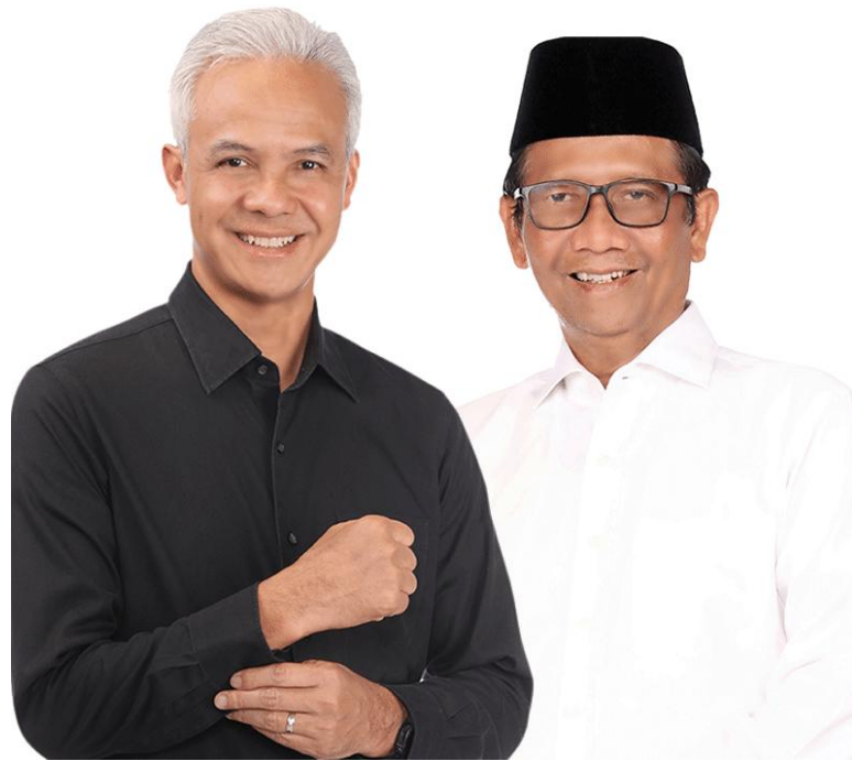
Gambar 2.2.1. Profil Ganjar Pranowo dan Mahfud MD