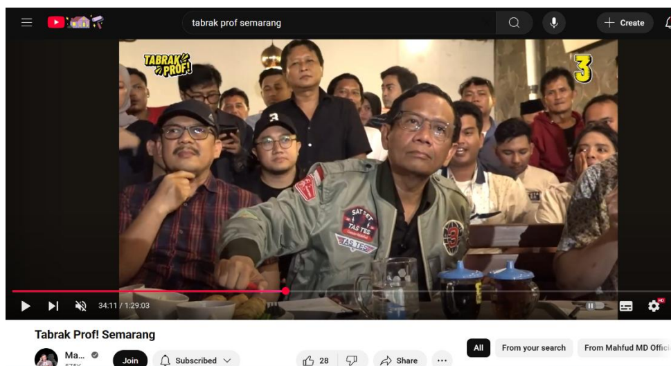
Gambar 2.3.1. Visualisasi Suasana Kampanye Tabrak, Prof!