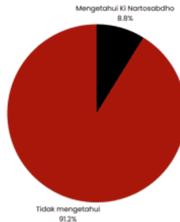
Gambar 1. 2 Diagram Tingkat Pengetahuan Audience Tentang Ki Nartosabdho

Oleh karena itu, strategi peningkatan pengetahuan mengenai Ki Narto Sabdo serta kelompok Ngesti Pandowo dipandang perlu difokuskan pada mahasiswa di Kota Semarang. Hal ini sejalan dengan posisi Semarang sebagai kota mahasiswa, yang menaungi berbagai perguruan tinggi besar seperti UNDIP, UNNES, UIN Walisongo, Polines, UNISULA, UDINUS, USM, Unika Soegijapranata, dan UNIMUS. Kesembilan kampus tersebut memiliki UKM dan komunitas kesenian Jawa yang potensial menjadi motor penggerak pelestarian budaya sekaligus jembatan untuk menghadirkan warisan seni ke generasi muda, khususnya para penggiat seni.