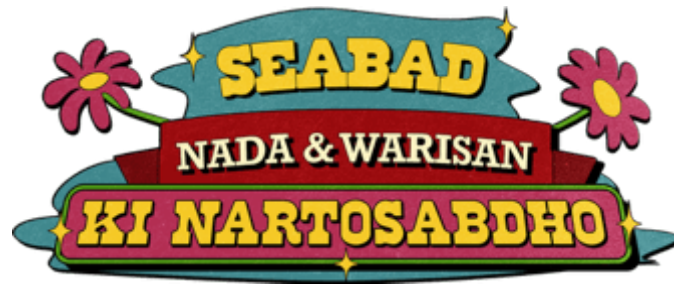
Gambar 1. 5 Logo Festival Seabad Nada & Warisan Ki Nartosabdho

Logo Seabad Nada dan Warisan Ki Nartosabdho merepresentasikan momentum peringatan seratus tahun kelahiran maestro seni pertunjukan Jawa. “Seabad” menegaskan warisan panjang beliau, sementara kombinasi warna kuning, merah, pink, dan hijau melambangkan kejayaan, semangat pembaruan, serta harapan akan kesinambungan tradisi. Elemen bunga memberi makna penghormatan dan keindahan budaya, sedangkan kilau bintang emas menegaskan nilai istimewa sosok Ki Nartosabdho. Dengan tipografi retro yang tegas namun memakai warna yang segar, logo ini memadukan nuansa tradisional dan modern agar lebih dekat dengan generasi muda, sekaligus menghidupkan semangat pelestarian budaya Jawa.