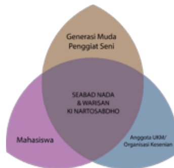
Gambar 1. 4 Segmentasi Festival Seabad Nada & Warisan Ki Nartosabdho

Festival Budaya Seabad Nada dan Warisan Ki Nartosabdho ditujukan kepada generasi muda penggiat seni di Semarang dengan menghadirkan tiga rangkaian inti acara. Pada 7 Oktober 2025 digelar pertunjukan musik tradisional dan kontemporer, diskusi karya sastra serta pameran visual mapping; 2 November 2025 diisi diskusi budaya bertema “Semangat Kontemporer” bersama komunitas seni; dan 16 November 2025 menghadirkan pertunjukan tari, musik, serta teater dari berbagai UKM dan komunitas seni sebagai ruang apresiasi dan regenerasi budaya Jawa.