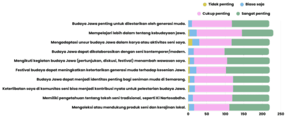
Gambar 1. 1 Sikap Dan Minat Responden Terhadap Ki Nartosabdho dan Budaya Jawa

pengetahuan dan kedekatan dengan warisan budaya lokal di tengah derasnya arus globalisasi.