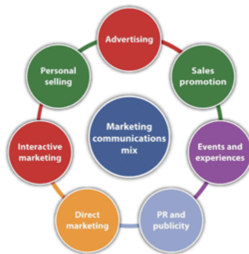
Gambar 1. 3 IMC Mix Tools

(Faculty of Communication Sciences, Universitas Pancasila, Jakarta, Indonesia dkk., 2024). Komponen utama IMC meliputi periklanan ( advertising ) untuk menyampaikan pesan secara luas, hubungan masyarakat dan publisitas ( public relations and publicity ) untuk membentuk citra positif, promosi penjualan ( sales promotion ) untuk memberikan stimulus atau insentif partisipasi, pemasaran langsung ( direct marketing ) untuk interaksi personal, pemasaran interaktif ( interactive marketing ) untuk komunikasi dua arah melalui media digital atau tatap muka, serta acara dan pengalaman ( events and experiences ) untuk memberikan pengalaman langsung yang berkesan. Dengan integrasi semua elemen ini, IMC tidak hanya menyebarkan informasi, tetapi juga meningkatkan kesadaran, pemahaman, dan keterlibatan audiens terhadap brand atau kegiatan yang dijalankan (Safitri, t.t.).