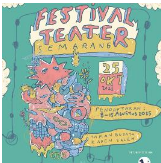
Gambar 2.4 Poster Festival teater Semarang

Dalam rangka menjaga keberlangsungan sekaligus mendorong perkembangan seni budaya di Kota Semarang, Dewan Kesenian Semarang secara berkelanjutan menginisiasi beragam program dan layanan kesenian. Inisiatif tersebut diarahkan untuk membuka ruang ekspresi yang luas bagi para seniman, meningkatkan tingkat apresiasi masyarakat terhadap karya seni, serta menumbuhkan keterlibatan aktif generasi muda melalui kerja sama lintas sektor yang melibatkan pemerintah, komunitas seni, dan institusi pendidikan. Peran Dekase sebagai fasilitator sekaligus mediator dalam ekosistem budaya tercermin secara konkret melalui penyelenggaraan kegiatan seperti Festival Teater Semarang, Sumbang Seni Semarang, serta berbagai pameran seni dan aktivitas apresiasi visual lainnya (PPID Kota Semarang, 2025).