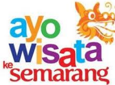
Gambar 2.7 Logo Dinas Kebudayaan dan Pariwisata Semarang

Keberlangsungan peran Dewan Kesenian Semarang dalam menjalankan mandat kesenian tidak dapat dilepaskan dari sinergi lintas pemangku kepentingan, dengan Dinas Kebudayaan dan Pariwisata Kota Semarang sebagai aktor utama. Sebagai institusi pemerintah yang memiliki kewenangan dalam perumusan kebijakan, fasilitasi, serta pengelolaan anggaran kebudayaan, Disbudpar memegang peran strategis dalam menopang keberlanjutan ekosistem seni daerah. Dalam relasi kemitraan ini, Dekase berfungsi sebagai mitra strategis yang mengoperasionalkan arah kebijakan pemerintah ke dalam pelaksanaan program, sehingga setiap inisiatif seni tetap sejalan dengan visi pembangunan kebudayaan yang telah ditetapkan.