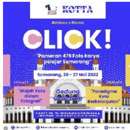
Gambar 2.6 Poster Pameran Foto Pelajar "Click!"

Melengkapi rangkaian program pertunjukan, Dewan Kesenian Semarang juga menginisiasi berbagai pameran seni dan kegiatan apresiasi visual sebagai wahana ekspresi, dengan fokus yang kuat pada keterlibatan seniman generasi muda. Salah satu bentuk implementasinya diwujudkan melalui penyelenggaraan pameran fotografi yang melibatkan pelajar serta komunitas seni. Pameran ini tidak hanya dimaksudkan sebagai sarana presentasi karya visual, tetapi juga sebagai upaya untuk meningkatkan apresiasi masyarakat terhadap seni rupa dan fotografi.