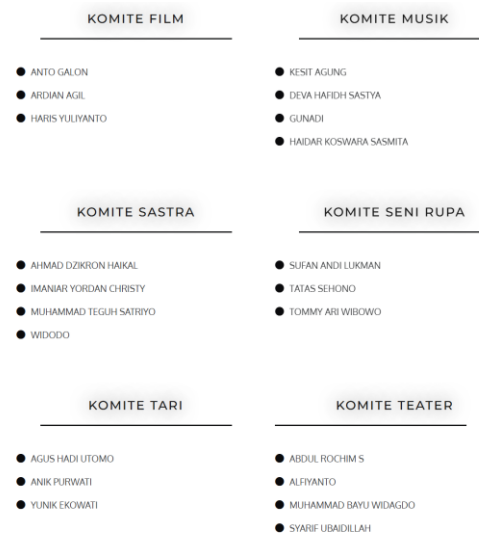
Gambar 2.3 Pengurus Komite Dewan Kesenian Semarang

sementara Ketua 2 Bidang Hubungan Masyarakat dijabat oleh Vikkir Rohman. Pada bidang Penelitian dan Pengembangan, tanggung jawab diberikan kepada Yvonne Sibuea sebagai Ketua 3. Adapun Ketua 4 Bidang Kerjasama dipercayakan kepada Ibnu Amar Muchsin, yang berperan dalam membangun dan mengelola relasi kemitraan.