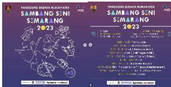
Gambar 2.5 Poster Sambang Seni Semarang 2023

Sambang Seni Semarang merupakan sebuah program pagelaran seni yang dirancang dengan konsep penyelenggaraan tersebar di berbagai kawasan Kota Semarang, dengan tujuan utama menghadirkan kesenian lebih dekat dengan kehidupan masyarakat. Program ini menyuguhkan ragam pertunjukan lintas disiplin, mulai dari musik, tari, hingga teater, yang dipentaskan secara terbuka dan inklusif di ruang publik maupun di lingkungan permukiman warga, sehingga seni tidak lagi terbatas pada ruang-ruang formal.