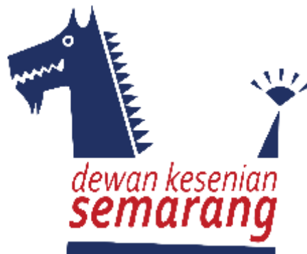
Gambar 2.1 Logo Dewan Kesenian Semarang

Berdasarkan Surat Keputusan Wali Kota Semarang Nomor 431/454 Tahun 2022, Dewan Kesenian Semarang secara resmi ditetapkan sebagai lembaga strategis yang berperan dalam pembinaan serta pengembangan seni di Kota Semarang. Ketentuan ini menegaskan posisi Dekase sebagai mitra penting pemerintah daerah dalam membangun jembatan komunikasi antara pemangku kebijakan, pelaku seni, dan masyarakat luas, dengan tujuan memperkuat apresiasi terhadap kesenian lokal. Sejalan dengan mandat tersebut, Dekase memiliki tanggung jawab merancang program pembinaan seni, menyelaraskan kerja sama lintas instansi, serta mendampingi proses penciptaan karya-karya seni baru. Selain itu, lembaga ini juga diberi kewenangan untuk menyampaikan masukan strategis