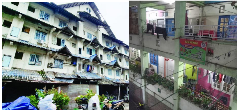
Gambar 2.5. Rumah Susun Bandarharjo