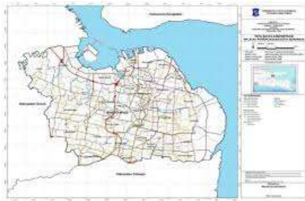
Gambar 2. 1 Peta Wilayah Administrasi Kota Surabaya Sumber : Ranwal RPJPD Kota Surabaya Tahun 2025-2045

Ibu Kota Provinsi Jawa Timur adalah Kota Surabaya dan termasuk salah satu kota Metropolitan di Indonesia. Kota Surabaya telah berkembang menjadi pusat ekonomi, pemerintahan, dan pendidikan, didukung oleh sektor jasa, industri, perdagangan, serta pelabuhan dan bandara berkelas (Pelabuhan Tanjung Perak dan Bandara Juanda) yang memperkuat posisinya sebagai titik distribusi strategis (ekonomi) regional maupun nasional. Letaknya di pesisir timur laut Pulau Jawa, Surabaya juga memiliki peran historis yang kuat sebagai “Kota Pahlawan” yang diperkuat oleh pertempuran heroik pada masa revolusi kemerdekaan.