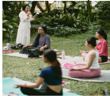
Gambar 2.2 Event Komunitas Kopi Susu Bu Lurah

kegiatan baca buku bersama yang berkolaborasi dengan Semarang Book Party dengan tujuan menyasar segmentasi pasar pecinta literasi dan kelas yoga yang berkolaborasi dengan komunitas Satu Nafas Yoga untuk menggaet pasar kaum muda dengan gaya hidup sehat.