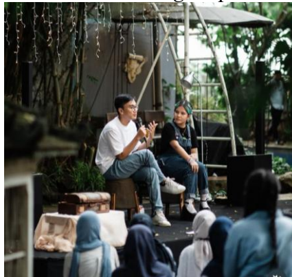
Gambar 2.1 Event Marketing Kopi Susu Bu Lurah

Kopi Susu Bu Lurah menggunakan event marketing sebagai salah satu strateginya untuk memperluas pasar konsumen dan mempertahankan loyalitas konsumen. Di cabang Semarang, Kopi Susu Bu Lurah sering mengadakan event mini concert yang berkolaborasi dengan musisi berskala nasional seperti Arash Buana, Adhitia Sofyan, dan Idgitaf. Event-event tersebut berfokus untuk menarik segmentasi penggemar dengan psikografis menyukai musik dan musisi yang tampil, yang disesuaikan dengan profil demografis pembeli Kopi Susu Bu Lurah.