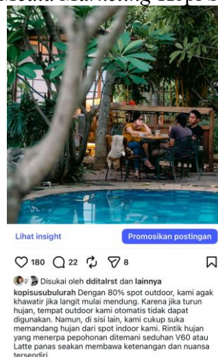
Gambar 2.3 Social Media Marketing Kopi Susu Bu Lurah

Dalam penggunaan media sosial, Kopi Susu Bu Lurah mempromosikan kegunaan tempat untuk kegiatan komunitas dan massal. Secara fungsional, Kopi Susu Bu Lurah memiliki keunggulan dibandingkan kompetitor kedai kopi lainnya berupa ketersediaan area indoor dan outdoor yang cukup luas memungkinkan Kopi Susu Bu Lurah untuk mengakomodasi beragam konsep acara. Strategi social media marketing yang diterapkan sebelumnya berupaya memaksimalkan dokumentasi dari setiap event marketing tersebut guna membentuk narasi bahwa Kopi Susu Bu Lurah adalah destinasi untuk kelompok komunitas. Kopi Susu Bu Lurah juga sering melakukan collaboration post di Instagram @kopisusubulurah dengan musisi yang pernah tampil, influencer, dan akun komunitas berbasis hobi.