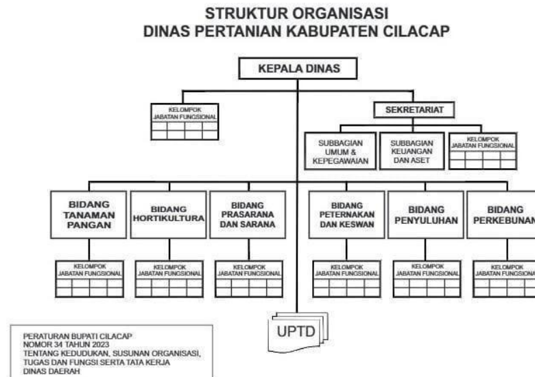
Gambar 2.3 Struktur Organisasi Dinas Pertanian Kabupaten Cilacap